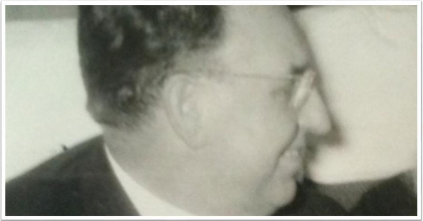
Εικόνα 9: Καθηγητής τῆς Γενικῆς Ἐκκλησιαστικῆς Ἱστορίας