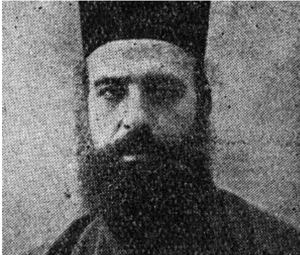
Εικόνα 8: Καθηγητής τῆς Ἐκκλησιαστικῆς Ἱστορίας.