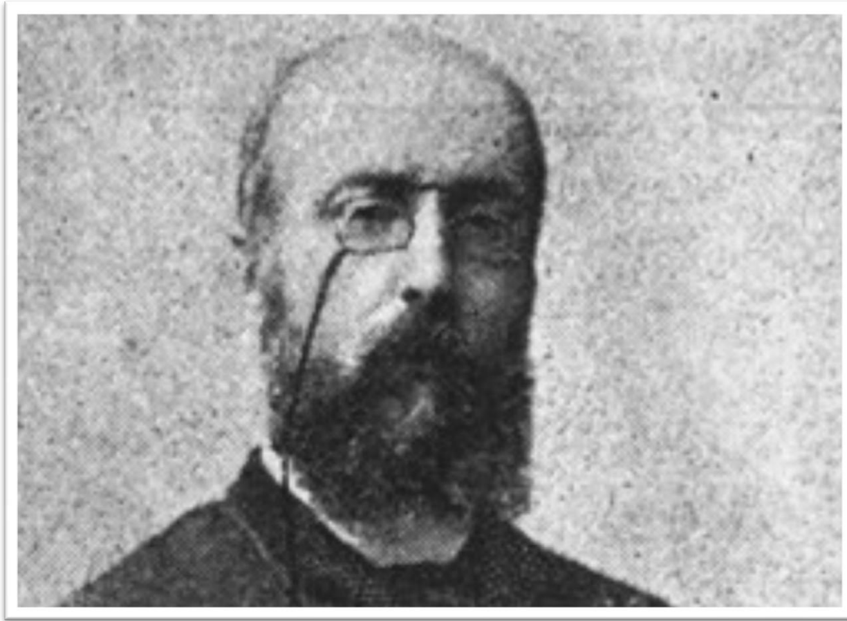
Εικόνα 6: Καθηγητής τῆς Ἐκκλησιαστικῆς Ἱστορίας καὶ Συμβολικῆς.