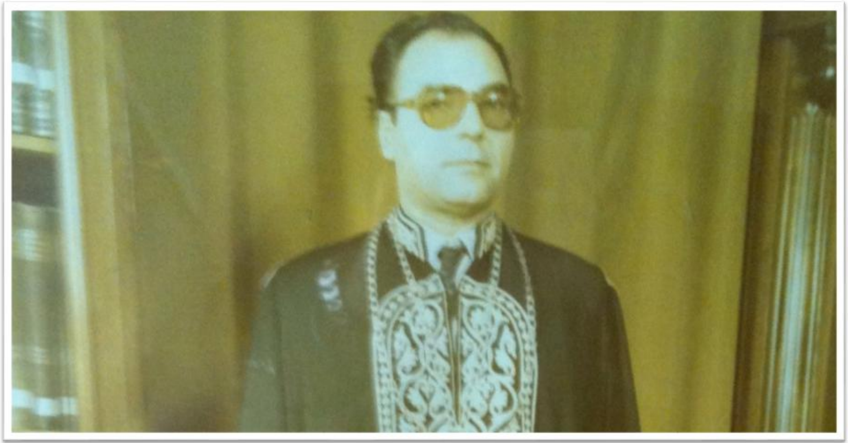
Εικόνα 10: Καθηγητής τῆς Γενικῆς Ἐκκλησιαστικῆς Ἱστορίας.