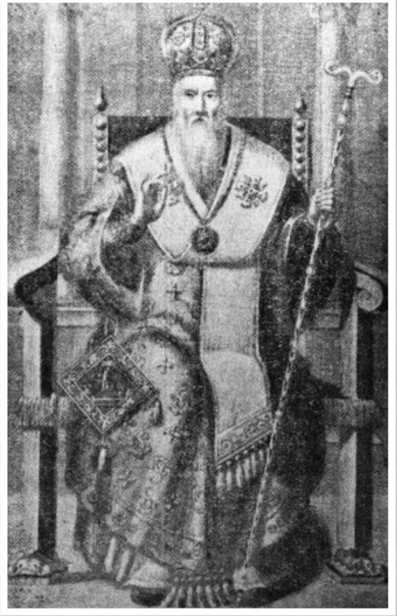
Εικόνα 2: ὁ ἀγωνιστῆς πατριάρχης.