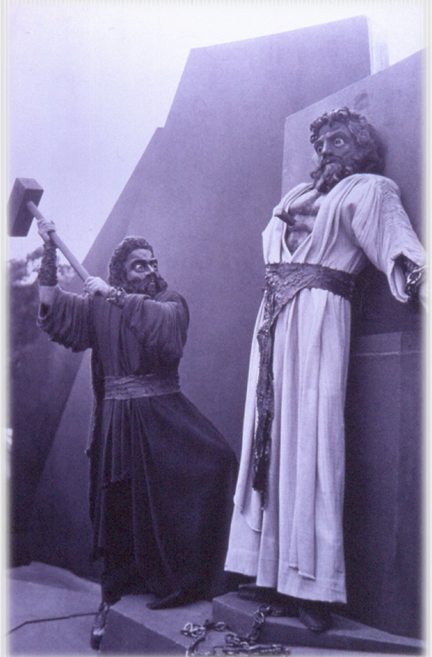
Εικόνα 3: «Εθνικό Θέατρο» 1963 Σκηνοθεσία: Αλ. Μινωτής