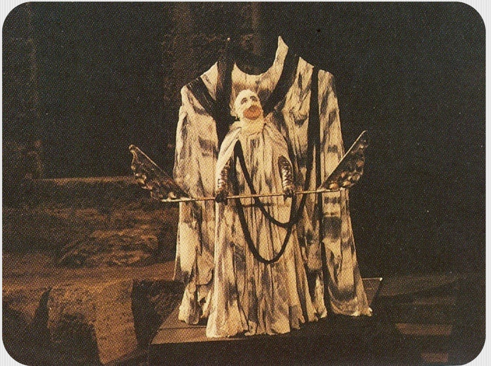
Εικόνα 8: «Αμφι-Θέατρο», 1983, σκηνοθεσία Σπύρου Ευαγγελάτου