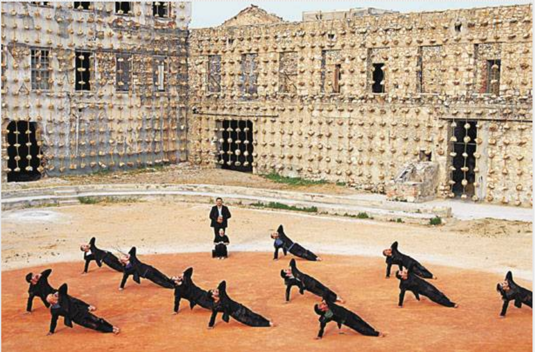
Εικόνα 2: Προμηθέας Δεσμώτης, θέατρο «Άττις», 2010, σκηνοθεσία: Θ. Τερζόπουλος