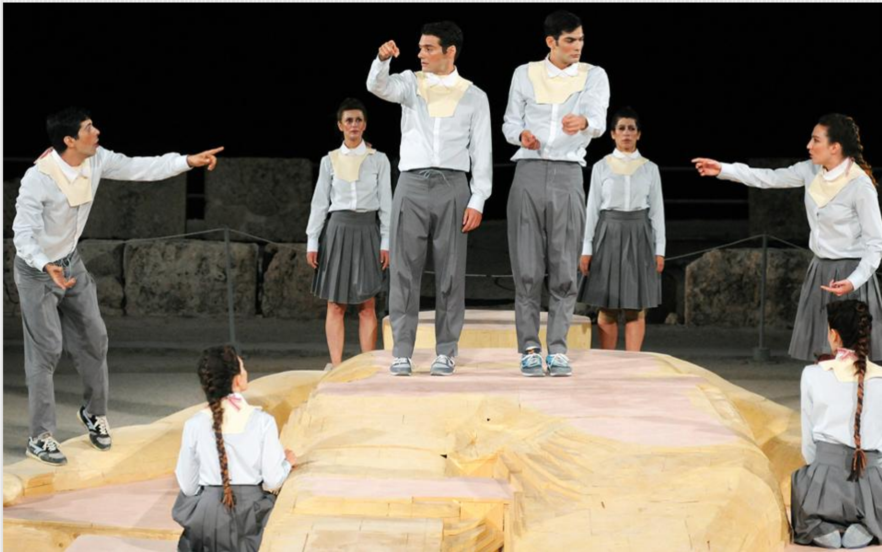
Εικόνα 13: Προμηθεύς Δεσμώτης , 2014, σκηνοθεσία: Έκτορας Λυγίζος