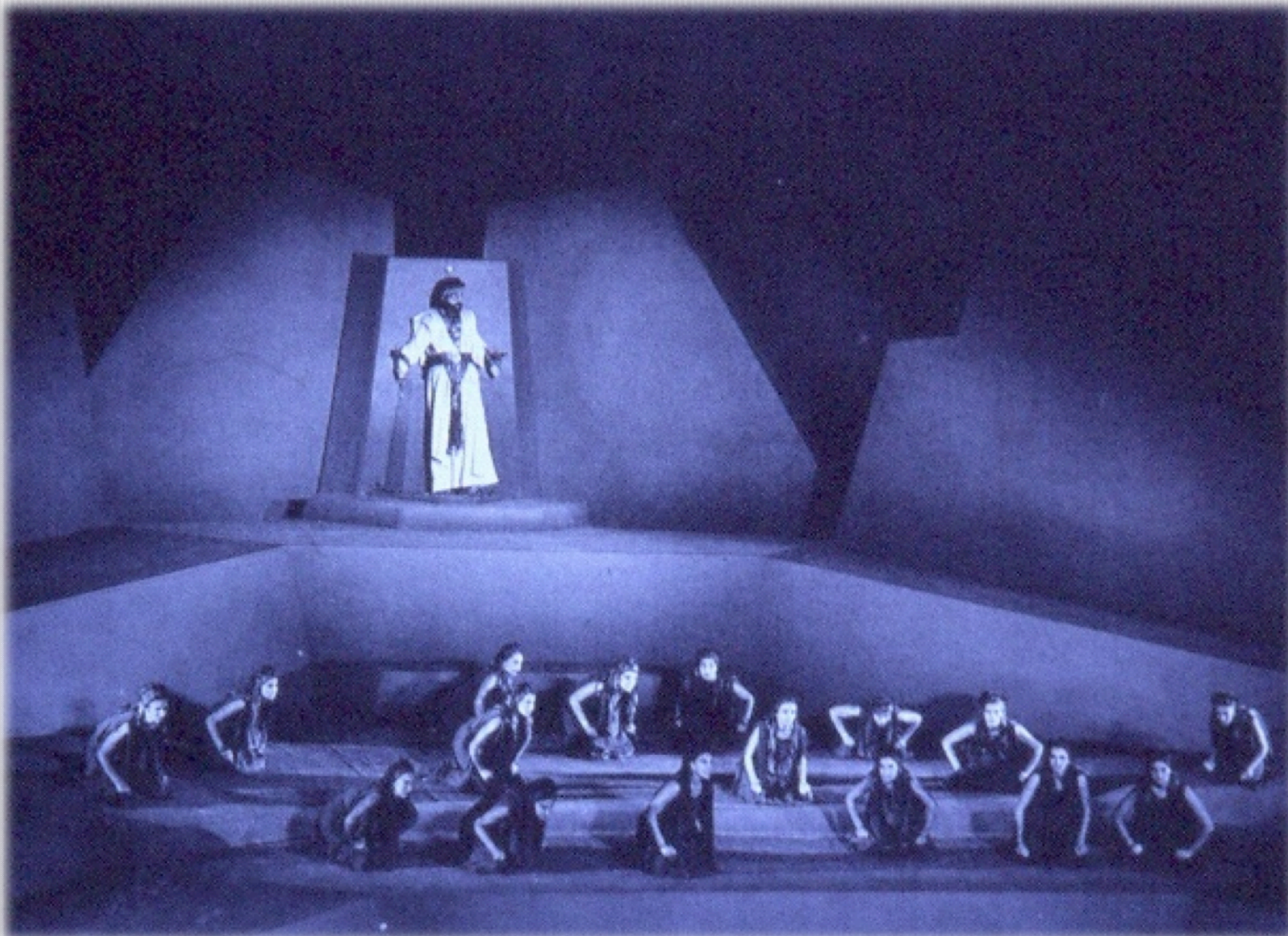
Εικόνα 5: «Εθνικό Θέατρο», 1963. Σκηνοθεσία: Αλ. Μινωτής (Προμηθεύς)