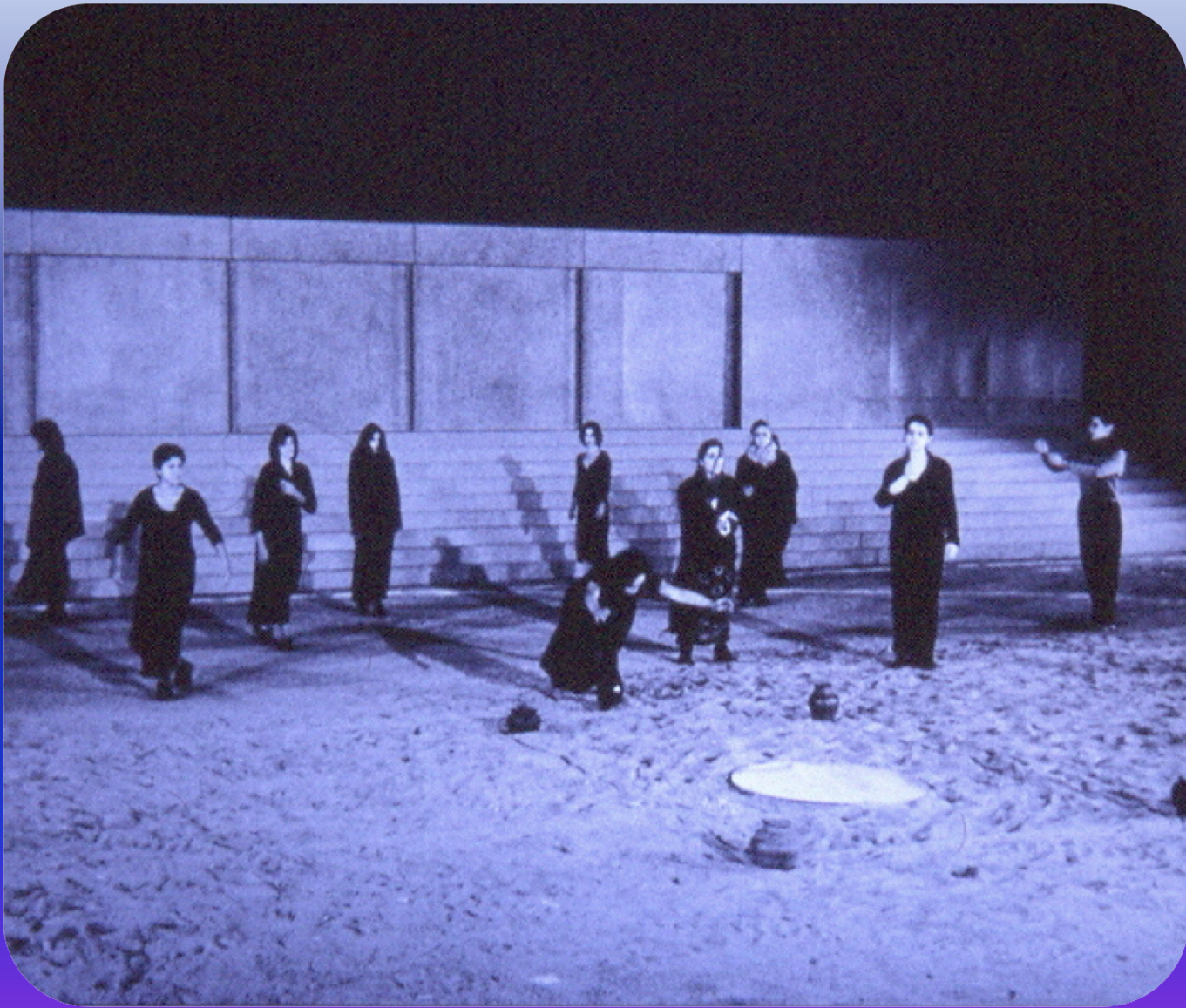
Εικόνα 2: Ορέστεια , Εθνικό θέατρο, 2001, σκηνοθεσία Γιάννη Κόκκου