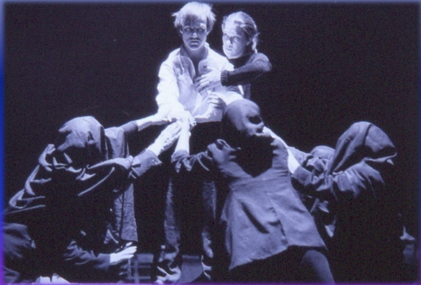
Εικόνα 1: Ακαδημαϊκό θέατρο του Ρωσικού Στρατού της Μόσχας. 1994 – Ορέστεια , σκηνοθεσία Πήτερ Στάιν