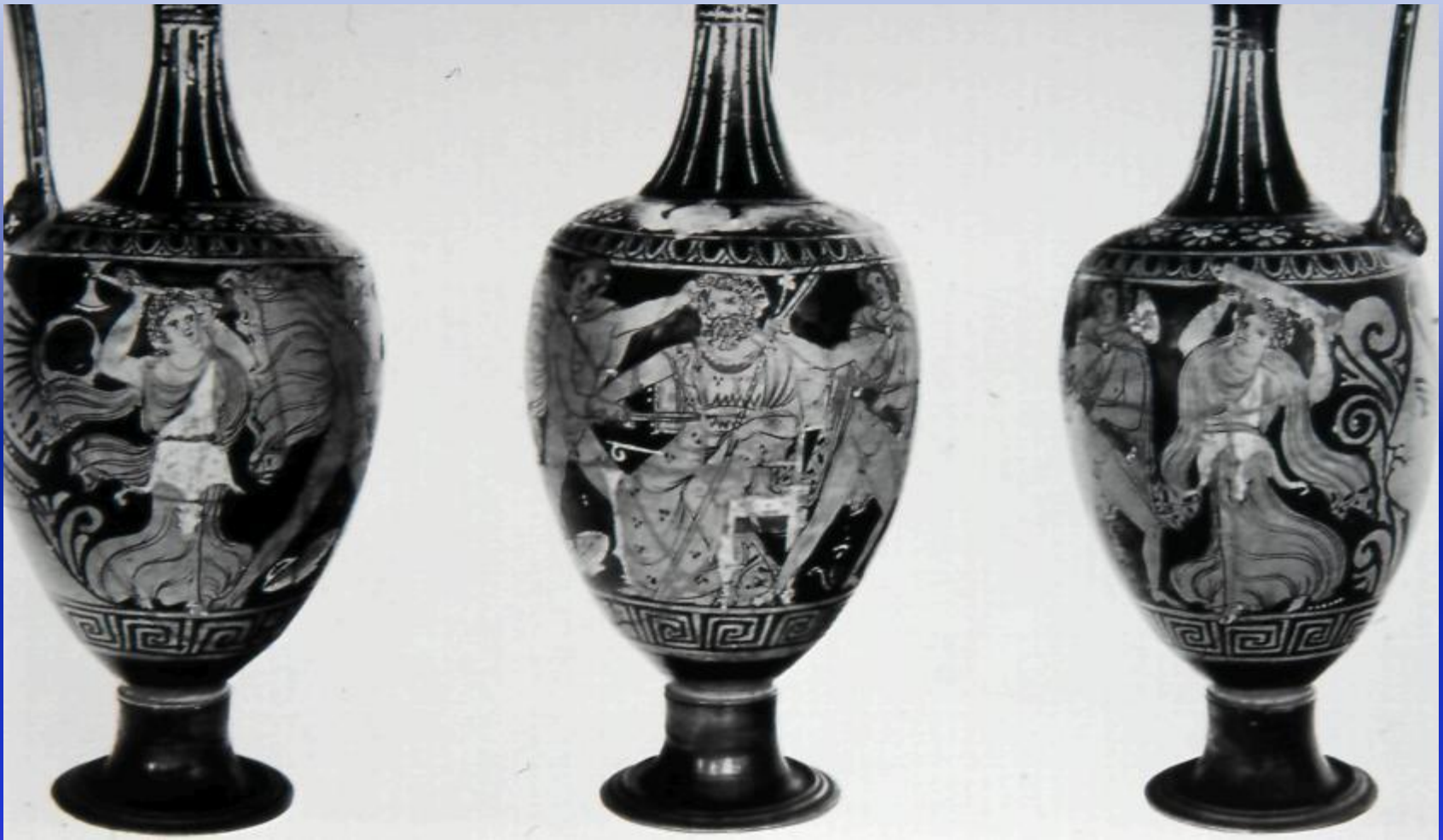
Εικόνα 8: Απουλική οينوχόη του τελευταίου τετάρτου του 4ου αι. π.Χ. Στο κέντρο της σύνθεσης ο Ορέστης με τον Πυλάδη προσπαθούν να σκοτώσουν τον ένθρονο Αίγισθο. Στην αριστερή πλευρά της σύνθεσης διακρίνεται μια γυναίκα με πέλεκυ στο χέρι (Κλυταιμνήστρα). Δεξιά μια άλλη γυναίκα (Ηλέκτρα) κρατά στα χέρια πόδι από καρέκλα.