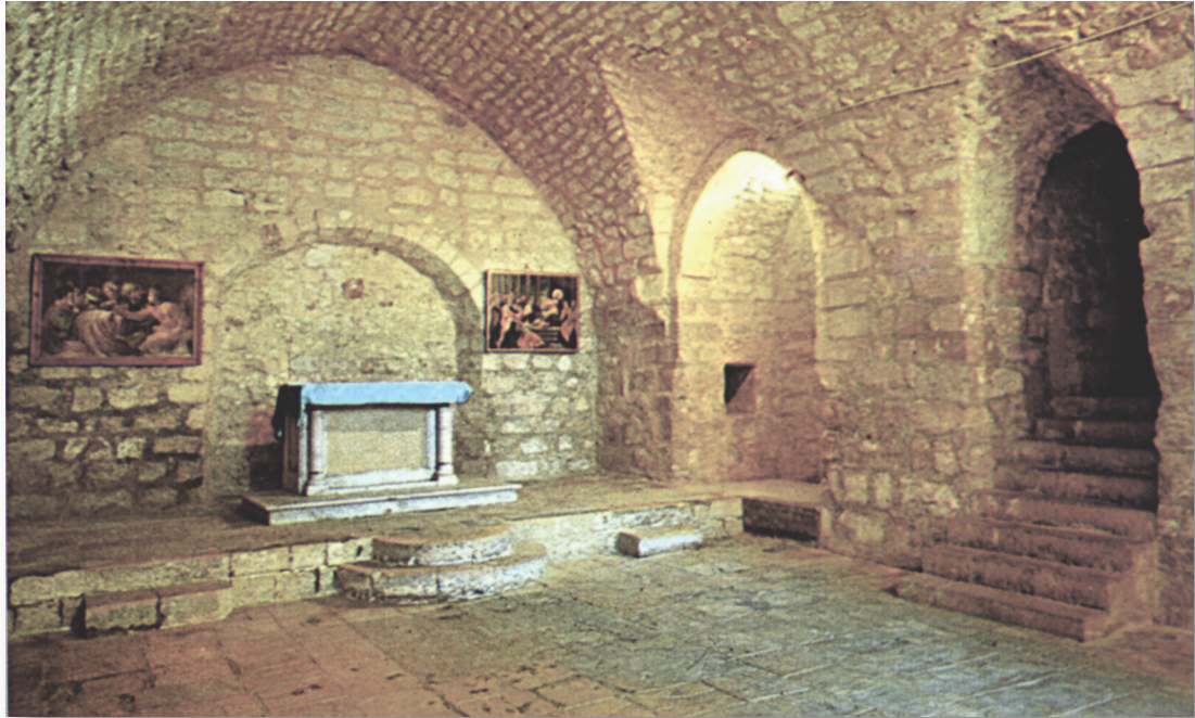
ΑΡΧΑΙΑ ΕΚΚΛΗΣΙΑ - ΙΣΡΑΗΛ

Τυπογραφεία: Α. Χονδρορίζος Μαραθωνομάχων 51, Αθήνα 10441 210 - 5126233