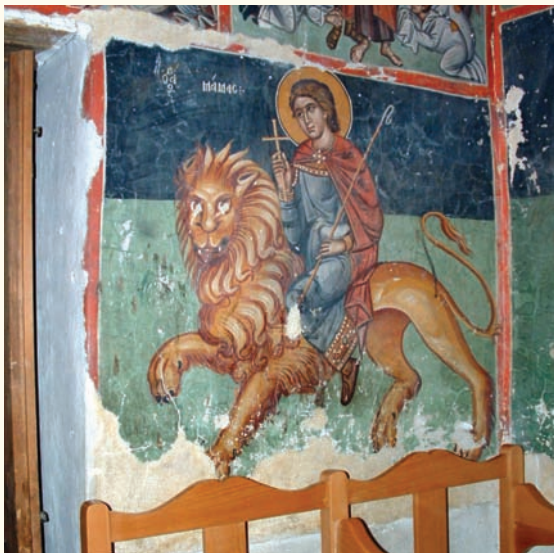
είκ. 17. Ο άγιος Μάμας.

στο δυτικό τοίχο του ναού και απαντώνται πολύ συχνά μαζί και σε άλλους ναούς της Κύπρου. Οί μικροδιαφορές που παρουσιάζονται έντοπίζονται κυρίως στην έλλειψη χώρου. Όπως διαφαίνεται από την απεικόνιση του αγίου Μάμαντος (είκ.17), πολιούχου Αγίου της