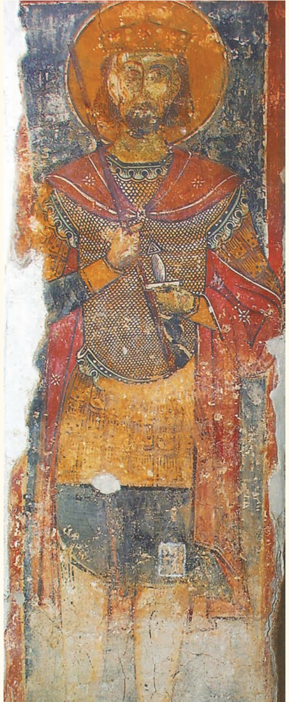
Ὁ ἅγιος Κωνσταντῖνος «ὁ τῆς Ὁρμυτίας» (τῆς Ὁρμίδειας). Τοιχογραφία στὸν παλαιὸ ναὸ τοῦ Σωτῆρος, Σωτήρα Ἀμμοχώστου (13ος αἰ.).