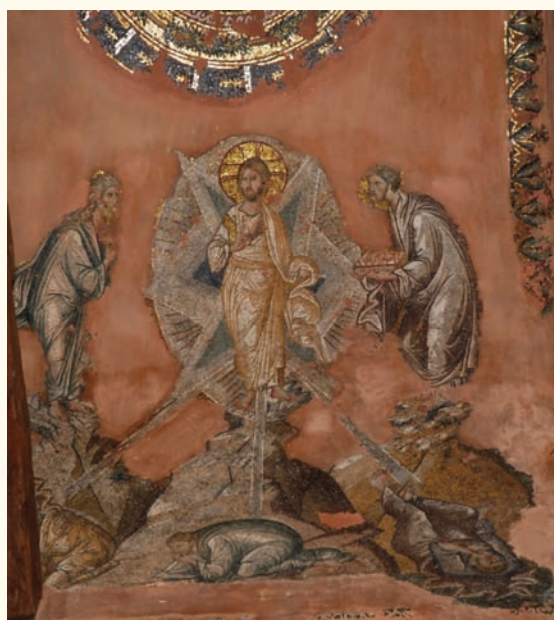
Εἰκ. 12. Ναὸς Ἁγίων Ἀποστόλων Θεσσαλονίκης. 1312-1315.

Μιὰ ἀκόμη εἰκονογραφικὴ λεπτομέρεια πού παρουσιάζει ἀλλαγὴ τὴν περίοδο αὐτή, εἶναι ἡ ἀπόδοση τοῦ ὄρους Θαβῶρ. Στὶς πρώιμες παραστάσεις τὸ ὄρος ἀπουσιάζει καὶ τὸ ἔδαφος ὑποδηλώνεται μὲ χρωματιστὲς λωρίδες, ὅπως στὸ ψηφιδωτὸ τοῦ Σινᾶ (εἰκ. 2) ἢ μὲ πράσινη χλόη, τὴν ὁποία κοσμοῦν ἄνθη, ὅπως στὴ Νέα Μονὴ Χίου (εἰκ. 3). Τὸ ὄρεινὸ τοπίο τοῦ Θαβῶρ ἀποδίδεται ἀπὸ τὸν 11ο αἰῶνα, ἀρχικά, μὲ μαλακὴ καμπύλη, ἐπάνω στὴν ὁποία πατᾶ ὁ Ἰησοῦς, ὅπως βλέπουμε στὸν κώδικα 1 (φ. 296β) τῆς Μονῆς Ἰβήρων (εἰκ. 4) 75 , στὴν Μονὴ Δαφνίου 76 κ.α. Ἦδη ἀπὸ τὴν μεσοβυζαντινὴν περίοδο, τὸ ὄρος σχηματοποιεῖται μὲ κλιμακωτοὺς βράχους, ὅπως σὲ εἰκόνα τοῦ