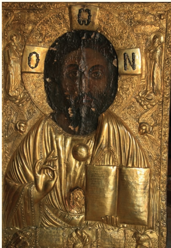
Ἡ εἰκόνα τοῦ Χρυσοσώτηρος Ἀκανθοῦ (πρόσφατη φωτογραφία)

καὶ τῶν ἁγίων Νικολάου καὶ Σπυρίδωνος, τοῦ ἁγίου Σάββα καὶ τῆς ἁγίας Ἄννας, ὅλες τοῦ 19ου αἰῶνα καὶ μιὰ εἰκόνα τοῦ ἁγίου Γεωργίου τῆς δεκαετίας τοῦ 1960 4 .