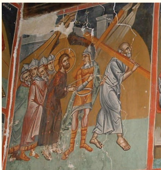
είκ.10. Έλκόμενος επί Σταυρού.

τριγυρίζεται από πλήθος Ιουδαίων που τον χλευάζουν ήχώντας βούκινα και άλλα μουσικά όργανα. Παρόμοια εικονογραφία με τον Λουβαρα και τον Άγιασματή παρουσιάζει ή σκηνή του Έλκομένου (είκ.10) με τον Σίμωνα στα δεξιά να μεταφέρει το σταυρό και να ακολουθείται από τον Ιησού που έλκεται από Ρωμαίο