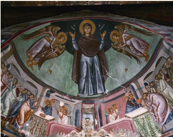
εἰκ. 2. Ἡ σύνθεση τῆς Θεοτόκου ὡς Κυρίας τῶν Ἀγγέλων, στὸ τεταρτοσφαίριο τῆς ἀψίδας τοῦ ἱεροῦ θήματος καὶ ἡ Κοινωνία καὶ ἡ Μετάληψη τῶν Ἀποστόλων στὸν ἡμικύλιωδρο τῆς ἀψίδας (ἀρχές 16ου αἰ.).

Ἡ σύνθεση τῆς Θεοτόκου ὡς Κυρίας τῶν Ἀγγέλων (εἰκ.2), στὸ τεταρτοσφαίριο τῆς ἀψίδας, παρουσιάζει τὴ Θεοτόκο ὄρθια χωρὶς τὸ Βρέφος, μὲ τὰ χέρια ὑψωμένα σὲ στάση δέησης ἀνάμεσα στοὺς σεβίζοντες Ἀρχαγγέλους Μιχαὴλ καὶ Γαβριὴλ, δέμα πού παρουσιάζεται μὲ πολλὲς ὁμοιότητες στὸ ναὸ τοῦ Ἁγίου Μάμαντος στὸν Λουβαρὰ (1495) καὶ στὸ ναὸ τοῦ Ἁγίου Νικολάου στὴ Γαλαταριά.