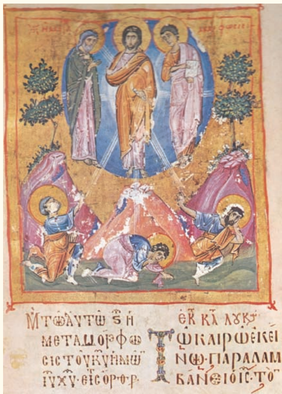
Εικ. 4. Κώδικας 1 (φ. 296β), Μονή Ίβήρων. 11 ος αιώνας.

σπάνια στάση του Ίακώβου, ο οποίος κλείνει το άρτί του, γεγονός που παραπέμπει στον φόβο των μαθητών από τη φωνή του Θεού και όχι από την παρουσία της νεφέλης 32 . Όμοια στάση παρουσιάζει ο Ίακωβος στο παρεκκλήσιο του Αγίου Νικολάου της Λαύρας (1560) 33 . Συνηθισμένη είναι και η πρηνής στάση του Ιωάννη στο κέντρο της παράστασης, στη Νέα Μονή της Χίου, ενώ σε εικόνα του τέλους του 12ου αιώνα στην Μονή Ξενοφώντος του Αγίου Όρους παρουσιάζει σπάνια στάση για την εικονογραφία του 34 . Ο απόστολος, όπως