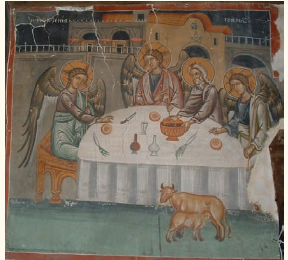
εἰκ. 14. Ἡ Φιλοξενία τοῦ Ἀβραάμ.

τὴν ἀπόδοση τῶν Ἀγγέλων, ὅσο καὶ τῆς τράπεζας πού ἀπεικονίζεται μὲ τὴν ἴδια προοπτική.