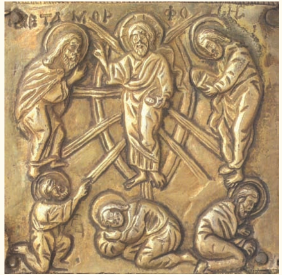
Είκ. 11. Πλαίσιο ἐπένδυσης εἰκόνας τῆς Παναγίας Ὁδηγήτριας (λεπτομέρεια). Μονὴ Βατοπαιδίου Ἁγίου Ὁρους. Ἀρχές τοῦ 14 ου αἰώνα.

παλαιολόγια περίοδο γίνεται κανόνας, ὅπως στὸ πλαίσιο ἐπένδυσης εἰκόνας τῆς Παναγίας Ὁδηγήτριας (εἰκ. 11) 44 κ.α. Ὁ Ίωάννης στὴ Νέα