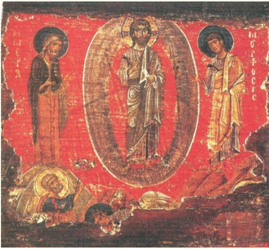
Είκ. 7. Αγία Πετρούπολη, Μουσείο Ερμιτάζ. Δεύτερο μισό 12ου αιώνα.

στην τοιχογραφία στον Άγιο Παντελεήμονα στο Νέρεζ 39 , ή μορφή του Ίωάννη στο κέντρο θυμίζει την αντίστοιχη του Πέτρου στο ψηφιδωτό της Μονής του Σινᾶ, ἐνῶ ὁ Ἰάκωβος δεξιά ἀποδίδεται μὲ μιὰ ἀσυνήθιστη ἡρεμία 40 . Σὲ εἰκόνα τῆς Μονῆς Ξενοφῶντος τοῦ Ἁγίου Ὁρους (τέλος 12ου αἰώνα) 41 , ὁ Μωυσῆς ἀποδίδεται ὡς γενειοφόρος μεσήλικας καὶ ὄχι ὡς ἀγένειος νεαρός, ὅπως κατὰ τὴ μεσοβυζαντινὴ περίοδο 42 . Ἀνάλογα ἀποδίδεται καὶ στοὺς Ἁγίους Ἀναργύρους Καστοριάς (γύρω στὰ 1180), στὸν Ἅγιο Γεώργιο στὸ Κουρμπίνοβο (1192) 43 , ἀπόδοση πού στὴν