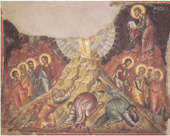
Είκ. 15. Άγιον Όρος, Μονή Σταυρονικήτα. 1545/6.

μικρές αποκλίσεις αποδίδεται ή σκηνή σε εικόνα (τρίπτυχο) του Βυζαντινού Μουσείου της Αθήνας (άρχες 17ου αιώνα) 97 . Το ίδιο συμβαίνει και σε άλλες μορφές τέχνης 98 .