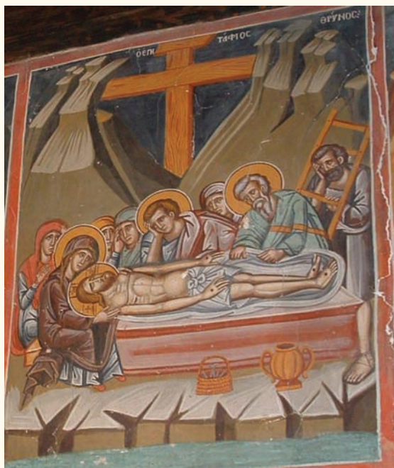
είκ. 11. Ο Έπιτάφιος Θρήνος.

στρατιώτη. Μεγάλη είναι επίσης ή όμοιότητα στην εικονογραφία καθώς επίσης και στην τεχνοτροπική απόδοση του Έπιταφίου Θρήνου (είκ.11) με την αντίστοιχη σκηνή στον Άγια-