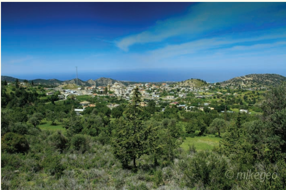
Πανοραμικὴ ἄποψη τῆς Ἀκανδοῦς.

Εὐαγγέλιο. Τὸ σταυρόμορφο φωτοστέφανό Του φέρει τὴν ἐπιγραφή Ο ΩΝ. Μπροστὰ στὸ στήθος ὑπάρχει δίσκος πού ἀποδίδει τὴν ὑδρόγειο σφαῖρα καὶ χαμηλότερα ἀνοίγεται ὀμφαλὸς πού κλείνει μὲ θυρίδα μὲ ἑξαπτέρυγο γιὰ τὴν προσκύνηση τῆς εἰκόνας ἀπὸ τοὺς πιστοὺς. Ἐσωτερικὰ φέρει ἐγχάρακτο τὰ ὄνομα τοῦ Ἀρχιεπισκόπου Παναρέτου καὶ τῆ