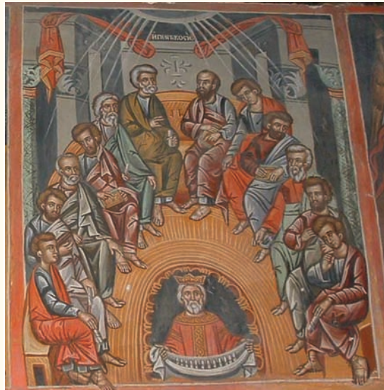
εἰκ. 13. Ἡ Πεντηκοστή.

(εἰκ.13) μὲ ἐκεῖνες στὰ μνημεῖα τοῦ Φιλίππου Γούλ. Στὴν σκηνὴ τῆς Φιλοξενίας τοῦ Ἀβραάμ (εἰκ.14) παρὰ τὰ διαφορετικὰ ἀρχιτεκτονήματα τοῦ βάνδου ἀκολουθεῖται ἀνάλογη εἰκονογραφία ὅπως στὸν Λουβάρ, τόσο ὡς πρὸς