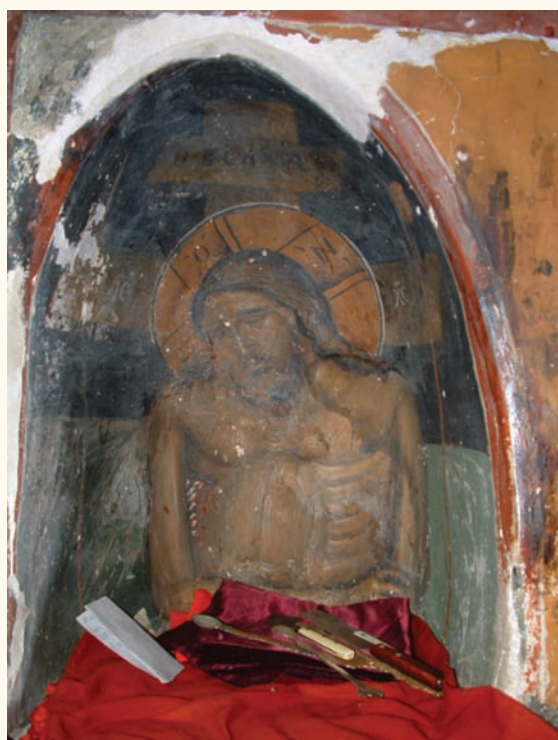
είκ. 19. Ἡ Ἄκρα Ταπείνωσι, τοιχογραφία στὴν κόγχη τῆς Προθέσεως τοῦ ναοῦ τῆς Μεταμορφώσεως τοῦ Σωτῆρος Παλαιχωρίου (ἀρχές 16ου αἰ.).

νολογία. Ἀπὸ τὰ στοιχεῖα καὶ τὶς συγκρίσεις ποὺ ἔχουν παρατεθεῖ πιστεύω ὅτι εἶναι καταφανεῖς οἱ σχέσεις τῶν τοιχογραφιῶν τοῦ ναοῦ τῆς Μεταμορφώσεως τοῦ Σωτῆρος στὸ Παλαιχώρι μὲ ἐκεῖνες τοῦ Φίλιππου Γοῦλ στὸν Ἁγισμάτη (1494) καὶ στὸν Λουβαρὰ (1495).