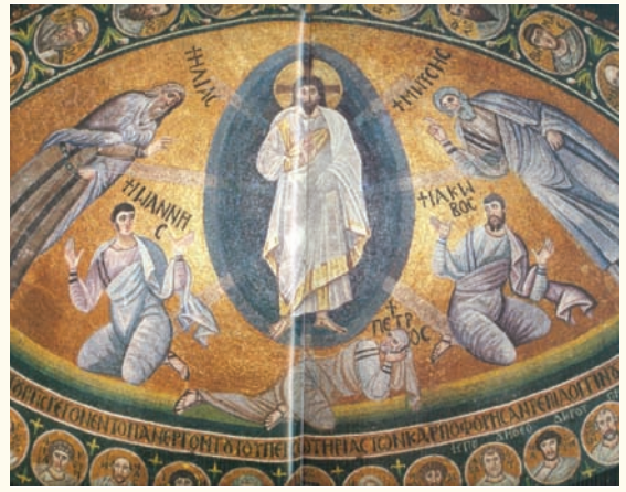
Εἰκ. 2. Καθολικὸ τῆς Μονῆς Σινᾶ. Μέσα τοῦ 6 ου αἰώνα.

δίσκου, μέσα σὲ χρυσὸ οὐρανὸ μὲ κόκκινα σύννεφα, πρὸς τὸν ὁποῖο δείχνει τὸ χέρι τοῦ Θεοῦ. Ὁ Μωυσῆς ἀριστερὰ καὶ ὁ Ἡλίας δεξιὰ, σὲ προτομή, ἀναδύονται μέσα ἀπὸ τὰ σύννεφα. Πιὸ κάτω οἱ ἀπόστολοι Πέτρος ἀριστερὰ καὶ Ἰωάννης καὶ Ἰάκωβος δεξιὰ, εἰκονίζονται σὰν τρία λευκὰ πρόβατα στὶς πλευρὲς τοῦ λόφου. Ἡ συγκεκριμένη περίπτωση ἀλληγορικῆς παράστασης τῆς Μεταμόρφωσης, ἀπὸ ὅσο γνωρίζουμε, εἶναι μοναδική.