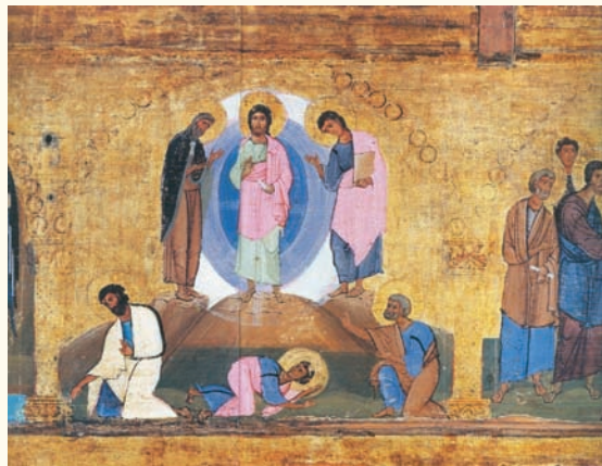
Εικ. 5. Ἐπιστύλιο μὲ σκηνὲς Δωδεκαῶρτου. Σινᾶ, Μονὴ Ἁγίας Αἰκατερίνης. Πρῶτο μισὸ 12ου αἰώνα.

ἀποτελοῦν μία ὁμάδα. Οἱ ἀρχαιότερες καὶ οἱ σύγχρονες πρὸς τὸ παρισινὸ κώδικα παραστάσεις (Paris) 25 παρουσιάζουν κάθε ἀπόστολο μεμονωμένο. Ἄλλοτε ὁ Ἰάκωβος ἱστορεῖται στὸ μέσο 26 καὶ ὁ Ἰωάννης δεξιά 27 ἢ ὁ Ἰάκωβος ἀριστερά (εἰκ. 5) 28 . Ὅμως ἡ