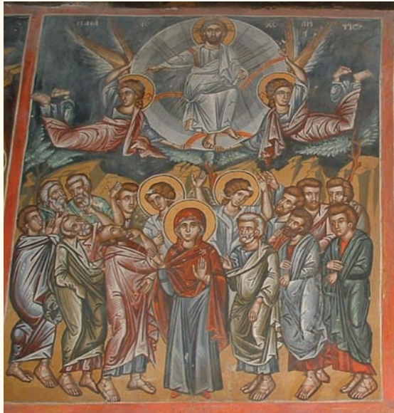
εἰκ. 12. Ἡ Ἀνάληψις.

σμάτη. Χαρακτηριστική είναι η απόδοση τῆς Θεοτόκου πού κρατεῖ τὸ κεφάλι τοῦ νεκροῦ Χριστοῦ καὶ τοῦ ἄγονου τοπίου μὲ τοὺς βραχῶδεις λόφους πού συγκλίνουν πρὸς τὸν σταυρὸ πού εὐρίσκεται ἀνάμεσά τους. Μοναδικὴ διαφορὰ ἀνάμεσα στὶς δύο σκηνές παρουσιάζει ἡ στάση τῆς Μαρίας Μαγδαληνῆς. Μὲ παρόμοιο τρόπο ἀπεικονίζονται οἱ σκηνές τῆς Ἀνάληψης (εἰκ.12) καὶ τῆς Πεντηκοστής