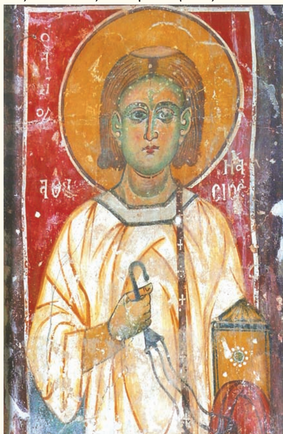
Ὁ ἅγιος Ἀθανάσιος ὁ Πεντασχοινίτης. Τοιχογραφία στὸν παλιὸ ναὸ τοῦ Σωτῆρος, Σωτήρα Ἀμμοχώστου (13ος αἰ.).

Τὸ καμπαναριὸ κτίστηκε τὸ 190 αἰώνα, μετὰ ἀπὸ τὴν ἔκδοση ἀπὸ τὴν Ὑψηλὴ Πύλη τοῦ διατάγματος τοῦ Χάττι Χουμαγιούν, σύμφωνα μὲ τὸ ὁποῖο δίνονταν ὀρισμένα προνόμια στοὺς ραγιαδες μεταξύ των ὁποίων καὶ ἡ χρησιμοποίησι κωδῶνων στοὺς ναοὺς. Ὅταν λοιπὸν κτίστηκε τὸ καμπαναριὸ καὶ κρεμάστηκε ἡ καμπάνα, ἕνα μερόνυχτο τὴν κτυποῦσαν οἱ κάτοικοι χαρούμενοι. Περνώντας δὲ ἕνας Τοῦρκος «τσαούσης» καβάλα στὸ ἄλογο, ἐρχόμενος ἀπὸ τὸ Παραλίμι καὶ πηγαινόντας στὸ Λιοπέτρι, εἶπε στοὺς ἑορτάζοντας κατοίκους «Ἐ γκιαούρηδες, ἴντα πού