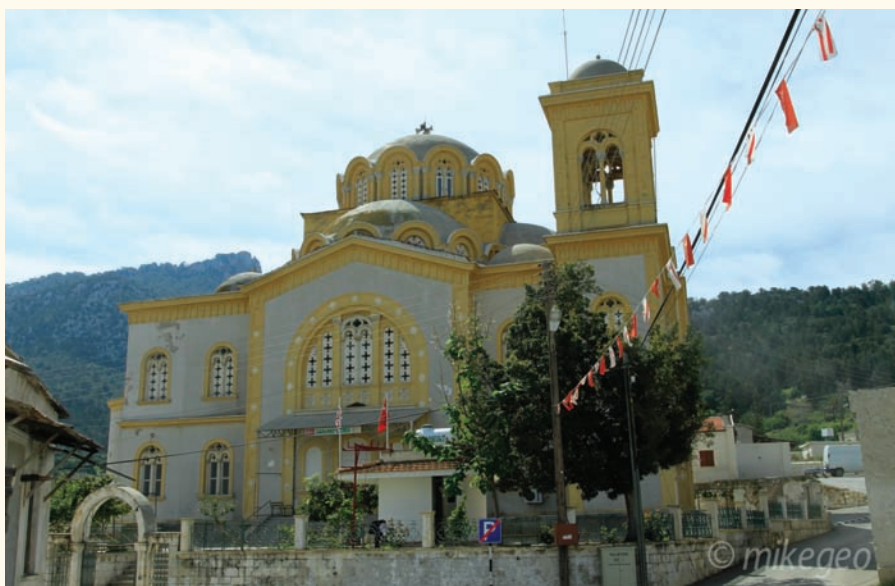
Ἱερὸς Ναὸς Χρυσοσώτηρος Ἀκανθοῦς (πρόσφατη φωτογραφία)