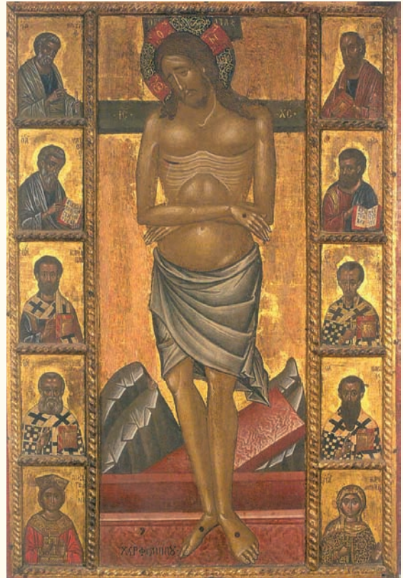
είκ. 18. Η Άκρα Ταπείωση, εικόνα στο Μουσείο Παλαιχωρίου που προέρχεται από το ναό της Παναγίας Χρυσοπαντάνας στο ίδιο χωριό.

Τη σχέση του Φίλιππου Γούλ με το Παλαιχώρι υποδεικνύει μία εικόνα Άκρας Ταπείωσης (είκ.18) στο Μουσείο Παλαιχωρίου που προέρχεται από το ναό της Χρυσοπαντάνας