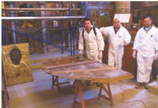
Ἔργασίες ἀπεντόμωσης εἰκόνων στὸν ἱερό ναὸ Ἁγίου Μάμαντος Μόρφου. Διακρίνεται ἀριστερὰ ἡ εἰκόνα τοῦ Χρυσοσώτηρος.

Ὁ Ἐπίτροπος ὅταν ἔφτασε στὸ χωριὸ ἀνάφερε τὸ γεγονός στους συγχωριανούς του καὶ τότε σχηματίστηκαν ὁμάδες καὶ βγήκαν σ' ἀναζήτηση τοῦ ζῶου καὶ τῆς εἰκόνας. Τελικὰ βρέθηκε τὸ ζῶο νεκρὸ μέσα σὲ ἕνα δάμνο σχοινιαῖς δίπλα στὰ ἐρείπια τῆς ἐκκλησιᾶς τοῦ διαλυθέντος συνοικισμοῦ τῆς Μελίσσας. Ἀπὸ τότε θεωρήθηκε ἱερὴ ἡ σχοινιά ἐκείνη καὶ κανένας δὲν ἤθελε καὶ δὲν τολμούσε νὰ κόψει ἕνα κλαδάκι». Στὸ χῶρο τῆς σχοινιαῖς στήθηκε πέτρινος στύλος ὕψους μισοῦ μέτρου, πάνω στὸν ὁποῖο ἀνάβαν οἱ Χριστιανοὶ μιὰ καντήλα.