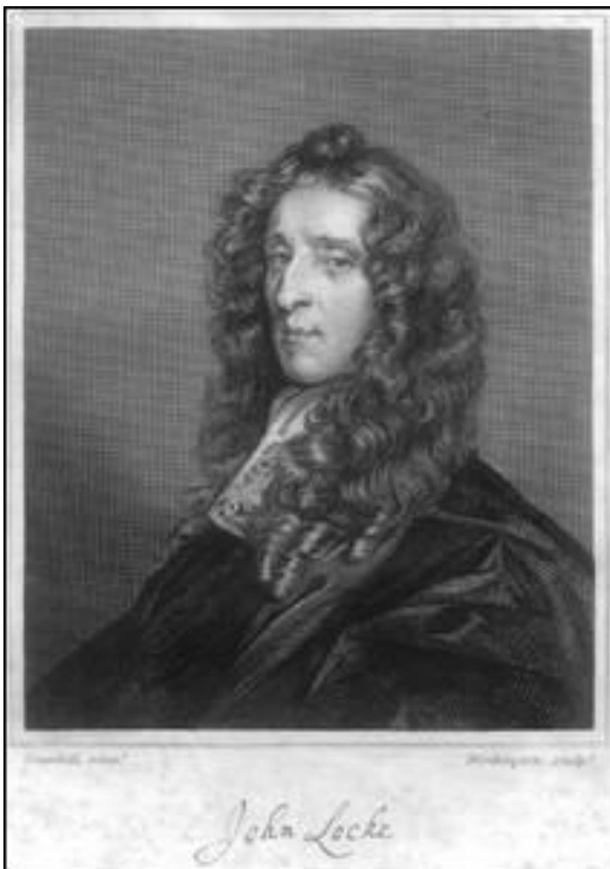
Χαρακτικό πορτραίτο του Locke φιλοτεχνημένο με βάση το έργο του John Greenhill (1672-1676). https://www99.libraries.psu.edu/tas/locke/mss/index.html