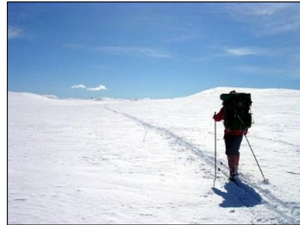
Χρήση των ευκαιριών που δίνονται από το περιβάλλον