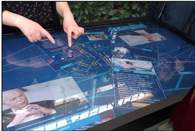
Προσαρμογή στις τεχνολογικές απαιτήσεις