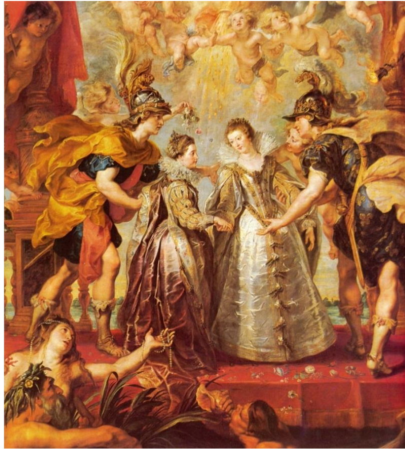
Les mariages franco-espagnols (1615)