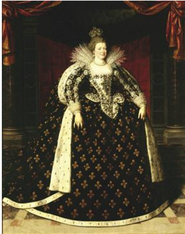
Marie de Médicis, Régente Portrait par Frans Pourbus (1610)