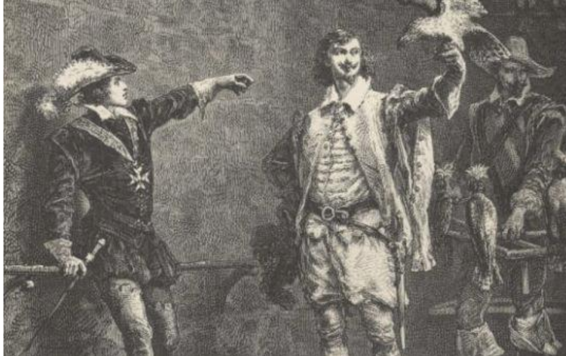
Charles d'Albert duc de Luynes et Louis XIII