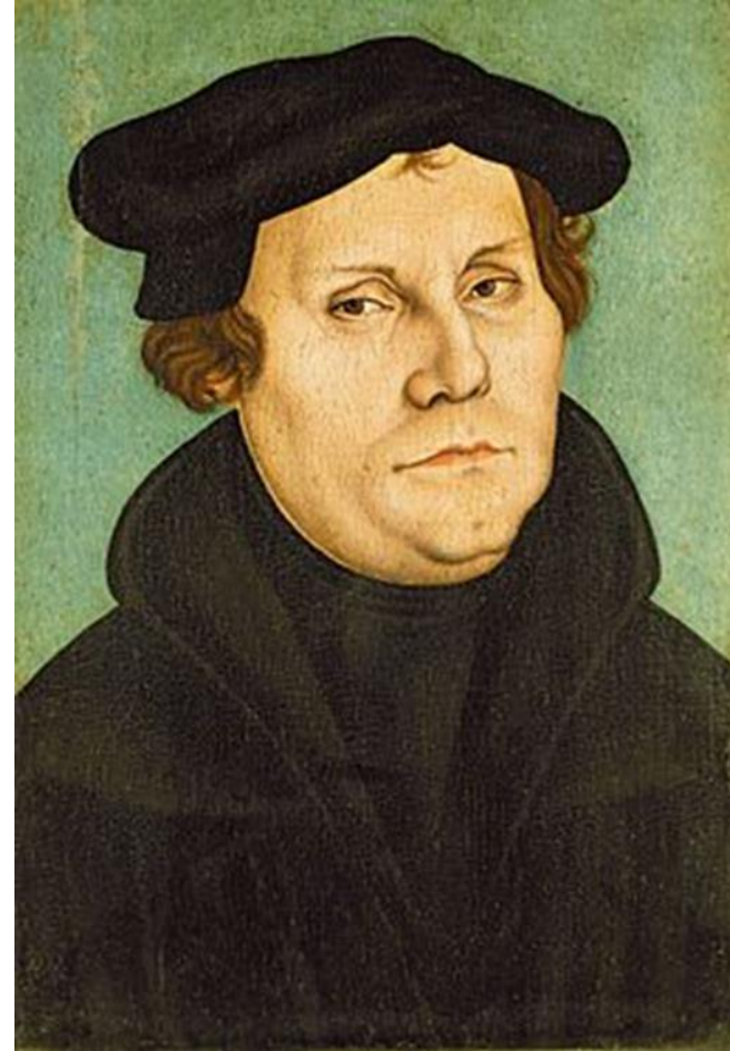
(Portrait réalisé par Lucas Cranach)

95 thèses ou arguments à discuter sont affichées sur la porte de l'église du château de Wittemberg (Saxe) à la veille de la Toussaint de 1517