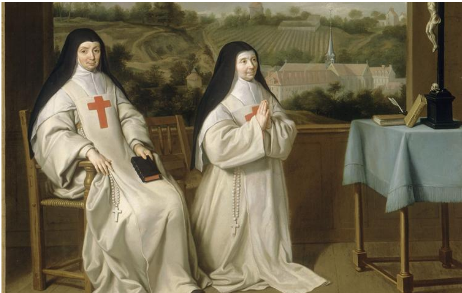
Philippe de Champaigne, Portrait de la mère Angélique et de la mère Agnès Arnauld (1662)