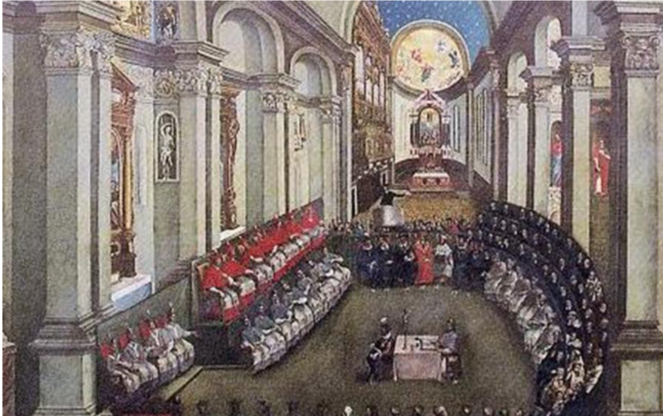
Le Concile de Trente (1545-1563)