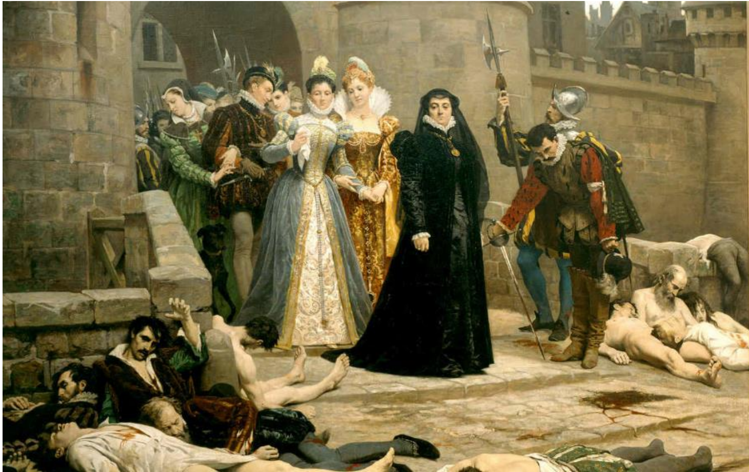
Catherine de Médicis dévisage les protestants massacrés au lendemain de la Saint-Barthélémy