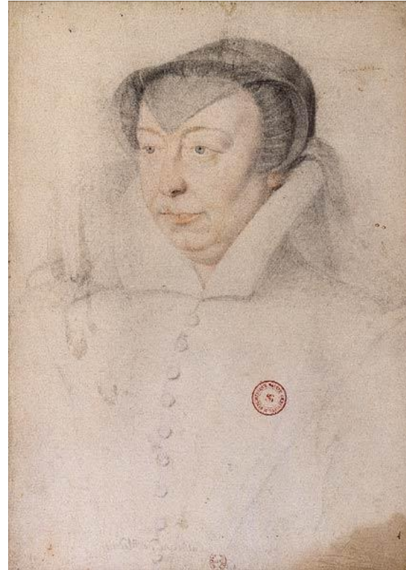
François Clouet, Catherine de Médicis ( v. 1585)