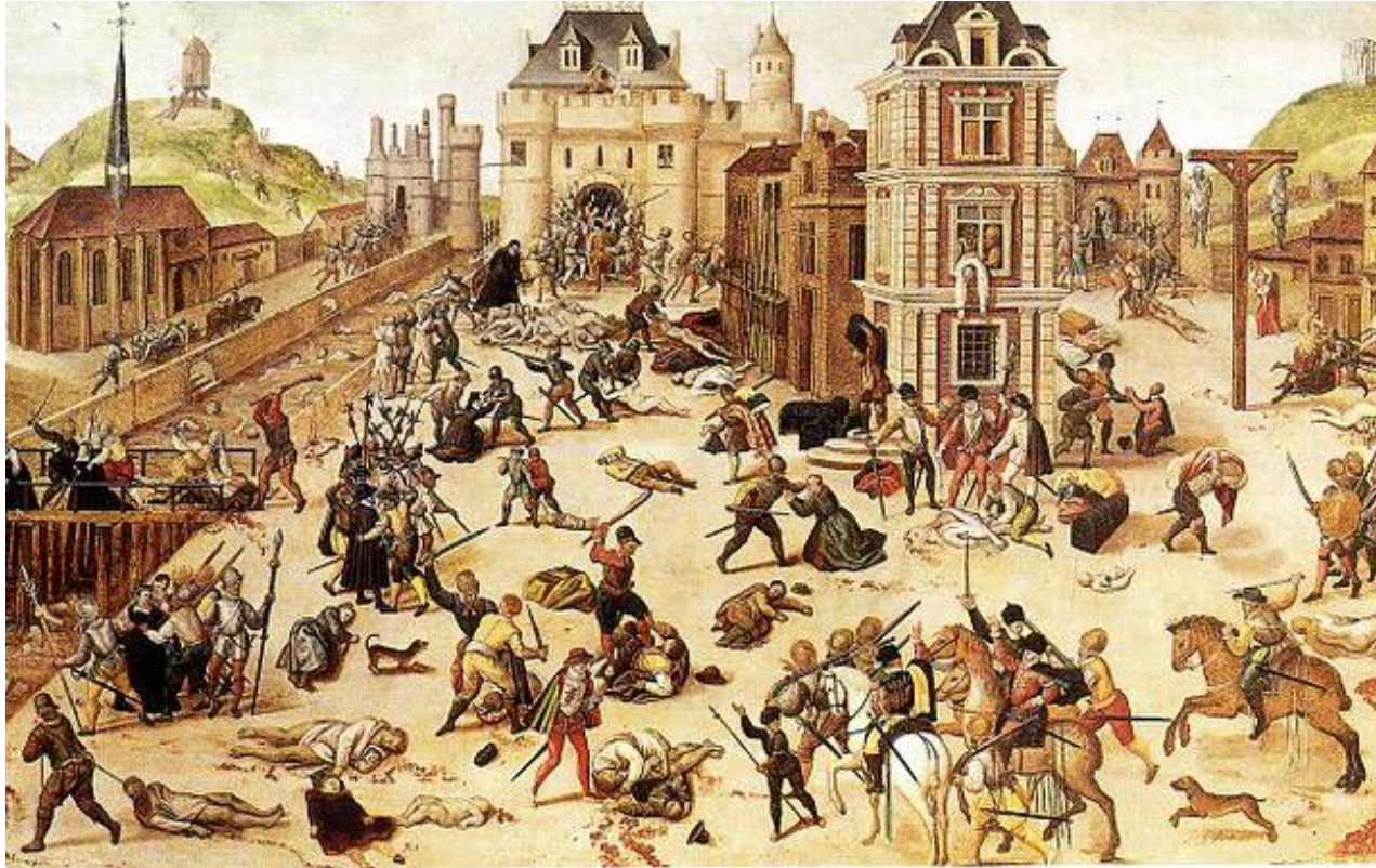
Tableau exécuté par François Dubois, (1572-84)