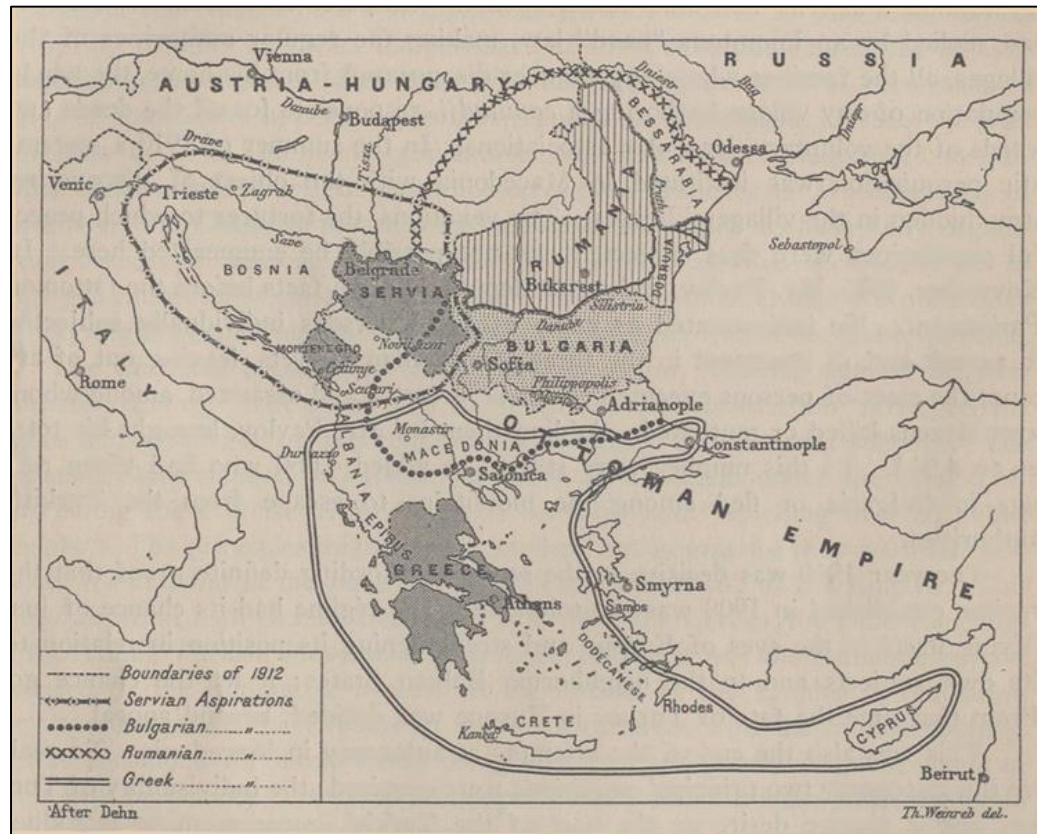
Balkan Aspirations (showing boundaries of 1912).