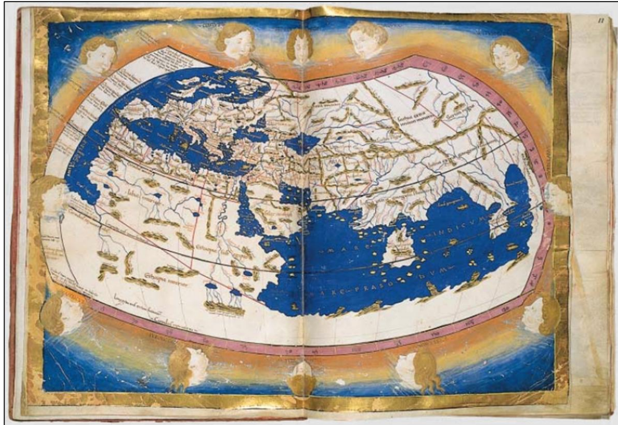
Ptolemy's world map (2nd century) in a 15th-century reconstruction.