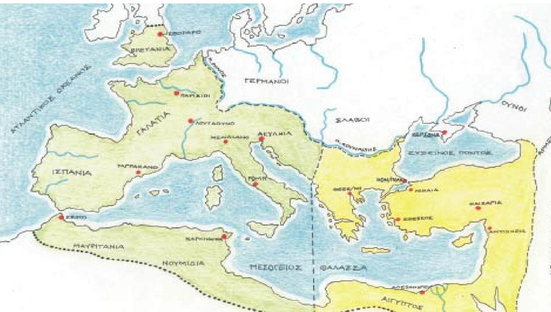
Εικόνα 3: Ο Ρωμαϊκός κόσμος