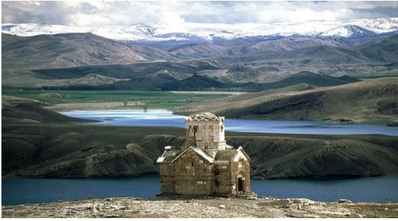
Εικόνα 2: Η Εκκλησία του Τιμίου Σταυρού στο νησί Aghtamar της λίμνης Van (ανατολική Τουρκία).