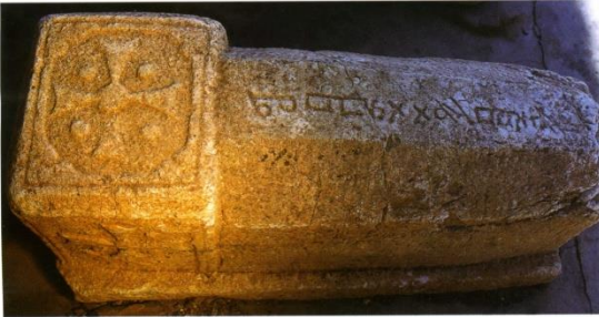
Εικόνα 1: Νεστοριανική σαρκοφάγος στο Olon Sume στην εσωτερική Μογγολία. Σε τουρκική γλώσσα και συριακή γραφή το όνομα του εκλιπόντος.