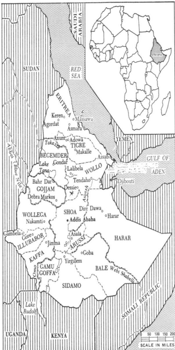
Εικόνα 1: Χάρτης με τα ιστορικά τμήματα του σημερινού κράτους της Αιθιοπίας.

Μετά από τὰ παραπάνω ακολουθεῖ μιά μακρά σκοτεινή περίοδος μέχρι τό 1200 περ., κατά τήν ὁποία ἡ πρόοδος τοῦ Ἰσλάμ στό ὑπόλοιπο Κέρασ τῆς Ἀφρικῆς ἀποκόπτει τήν Αἰθιοπία ἀπό τόν ὑπόλοιπο κόσμο, ἐνῶ συνεχίζεται ἡ σχέση της μέ τήν Αἴγυπτο. Στήν περίπτωση τοῦ Ἰσλάμ ἔχουμε κι ἐδῶ τό ἴδιο μοντέλο. Ἡ ἀρχική συνύπαρξη καί ἀνοχή (πού βασιζόταν στήν καλή εἰκόνα τοῦ Μωάμεθ, ἐπειδὴ οἱ Ἄραβες ἔβρισκαν καταφύγιο στήν Αἰθιοπία) ἀντικαταστάθηκε ἀπό τή στρατιωτική πίεση καί τούς διωγμούς