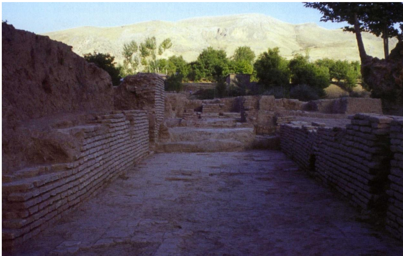
Εικόνα 4: Ερείπια νεστοριανικού μοναστηριού στο Urgut 30 χλμ. ΝΑ της Σαμαρκάνδης στο Ουζμπεκιστάν (ύστερος 9 ος αι.).