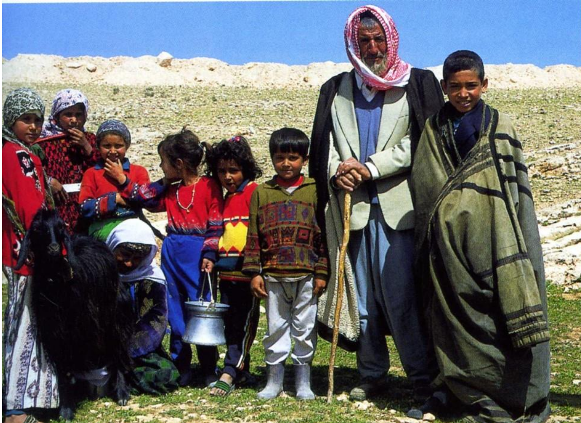
Εικόνα 10: Σημερινή χριστιανική οικογένεια στο Βόρειο Ιράκ (πριν τα πρόσφατα γεγονότα).