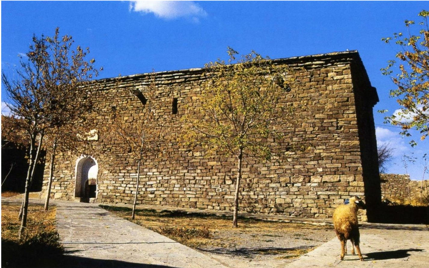
Εικόνα 3: Ναός Σεργίου και Βάκχου ΝΔ της Urmiah στην επαρχία Αζερμπαϊτζάν του Ιράν. Το πρόβατο κατόπιν θυσιάστηκε σε μνημόσυνο.