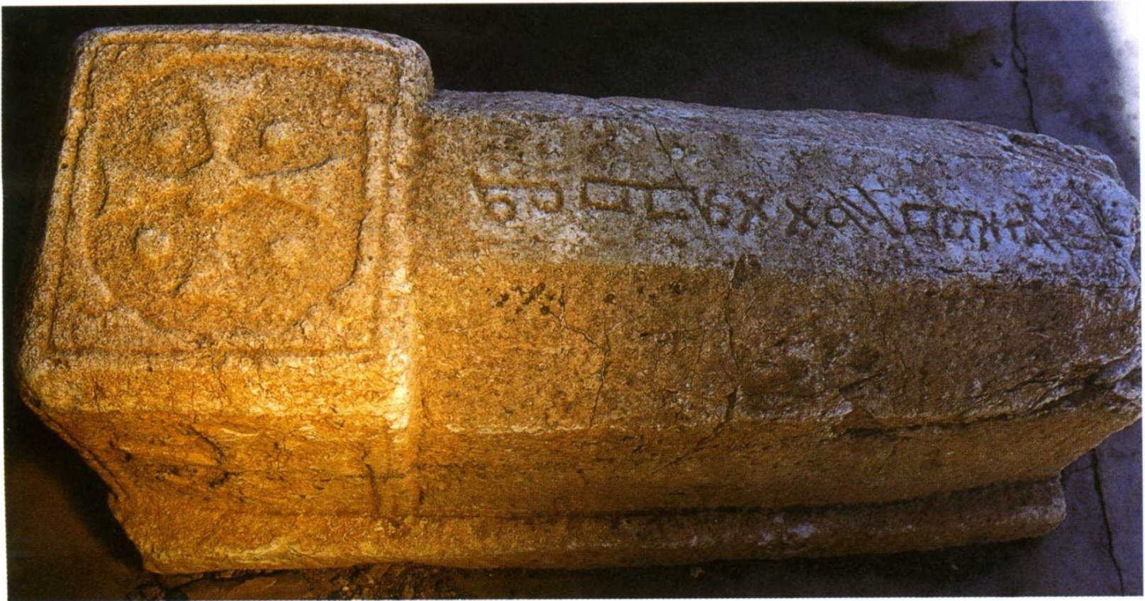
Εικόνα 5: Νεστοριανική σαρκοφάγος στο Olon Sume στην εσωτερική Μογγολία. Σε τουρκική γλώσσα και συριακή γραφή το όνομα του εκλιπόντος.