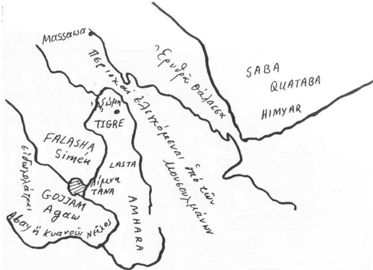
Εικόνα 6: Σχεδιάγραμμα του θρησκευτικού χάρτη της Αιθιοπίας κατά τη μεσαιωνική περίοδο.