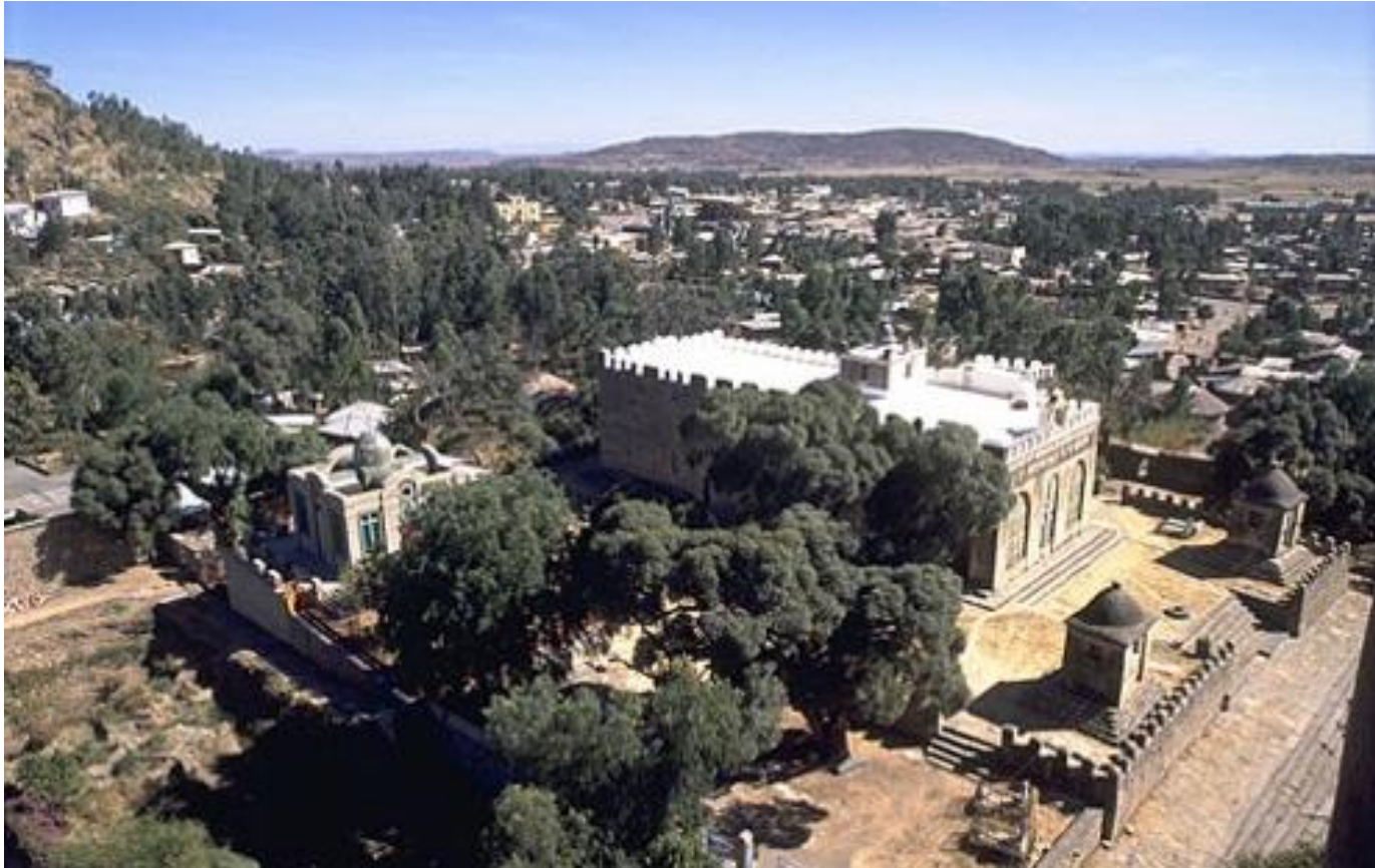
Εικόνα 10: Περίβολος της αγίας Μαρίας Σιών στην Αξώμη.