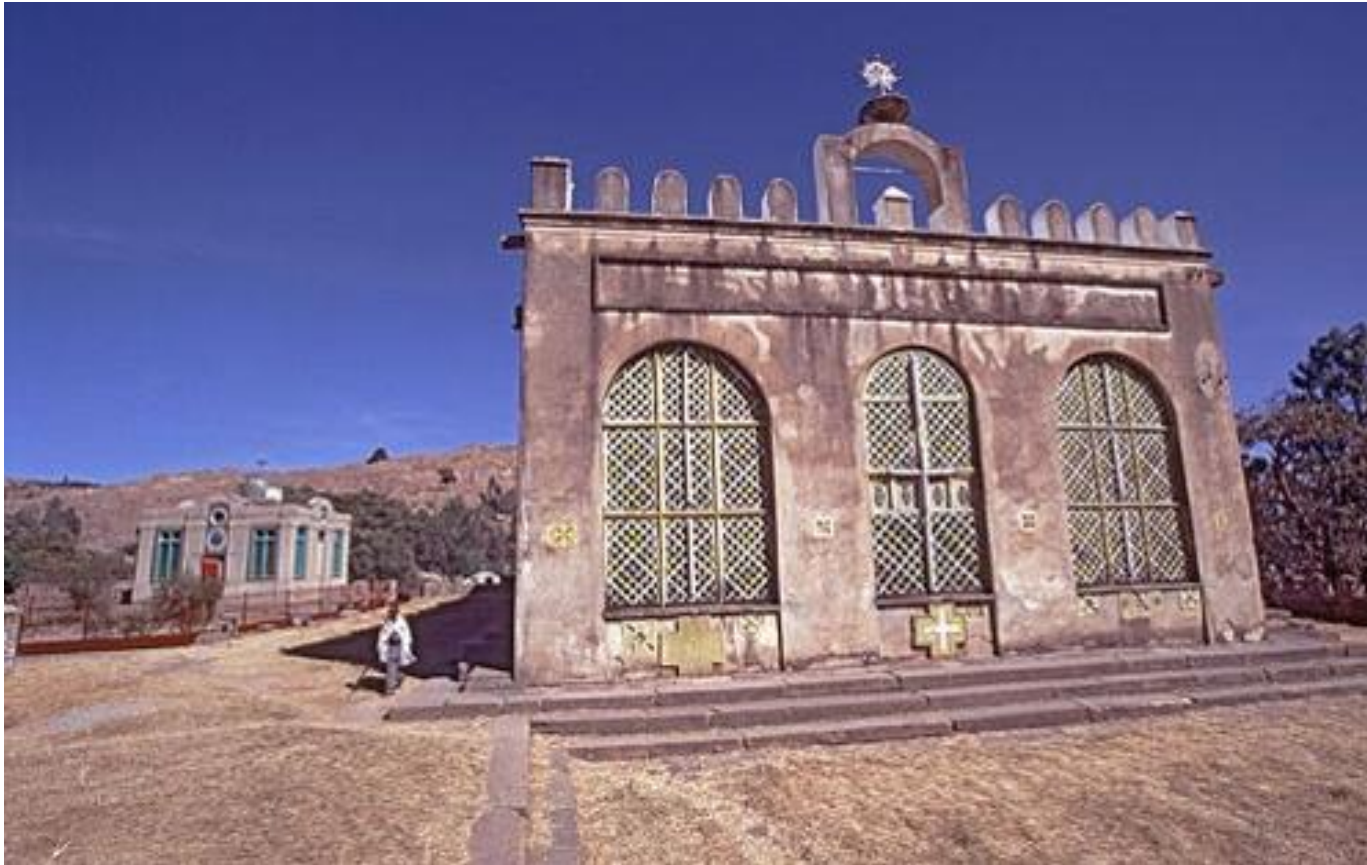
Εικόνα 11: Περίβολος της Αγίας Μαρίας Σιών στην Αξώμη.