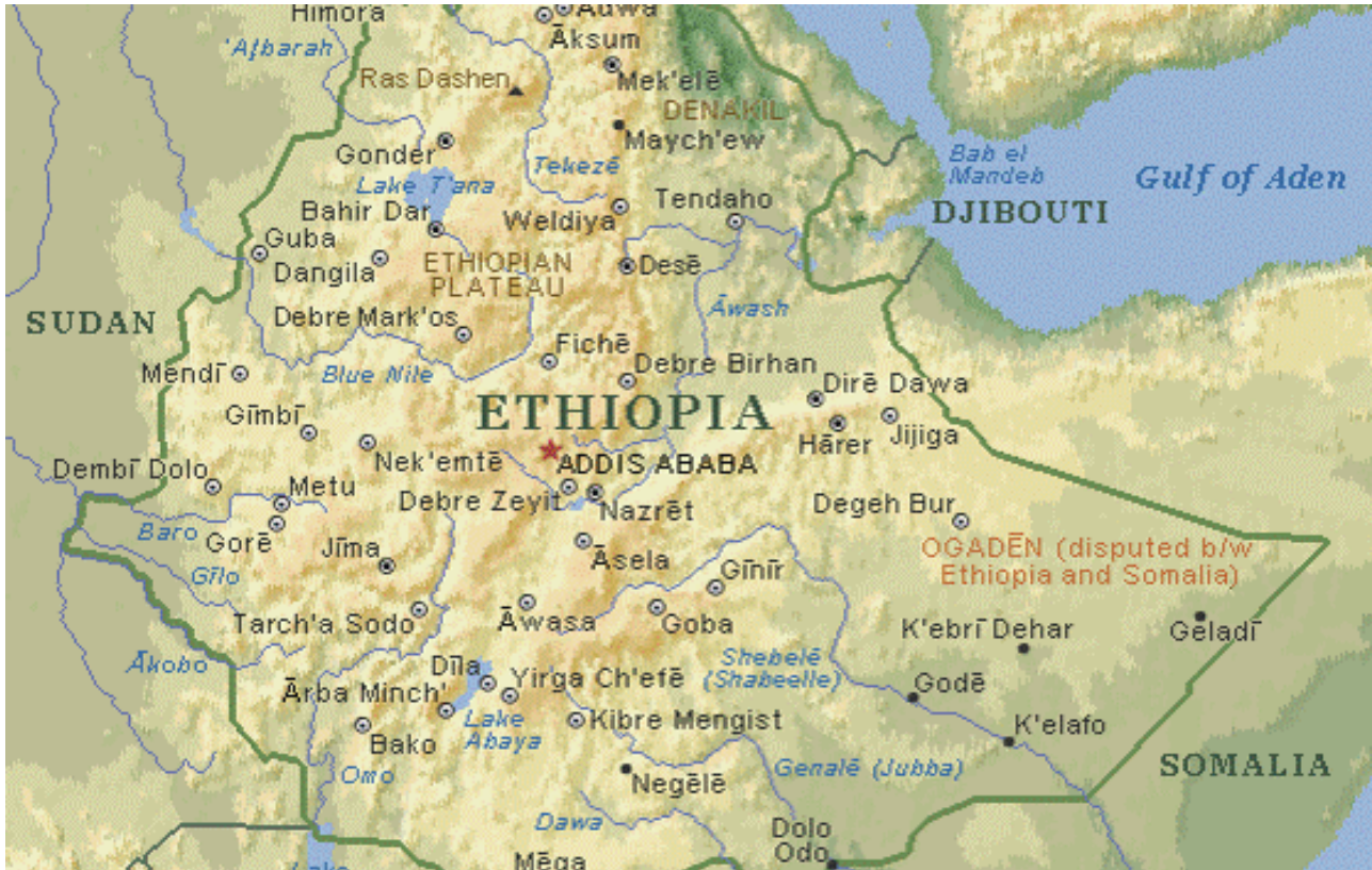
Εικόνα 2: Χάρτης του σημερινού κράτους της Αιθιοπίας.