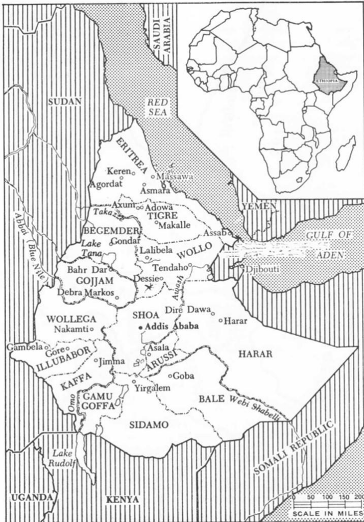
Εικόνα 3: Χάρτης με τα ιστορικά τμήματα του σημερινού κράτους της Αιθιοπίας.