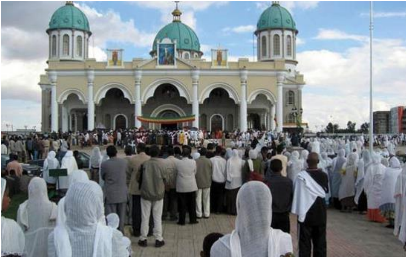
Εικόνα 12: Τελετή σε ναό της Αντίς Αμπέμπα