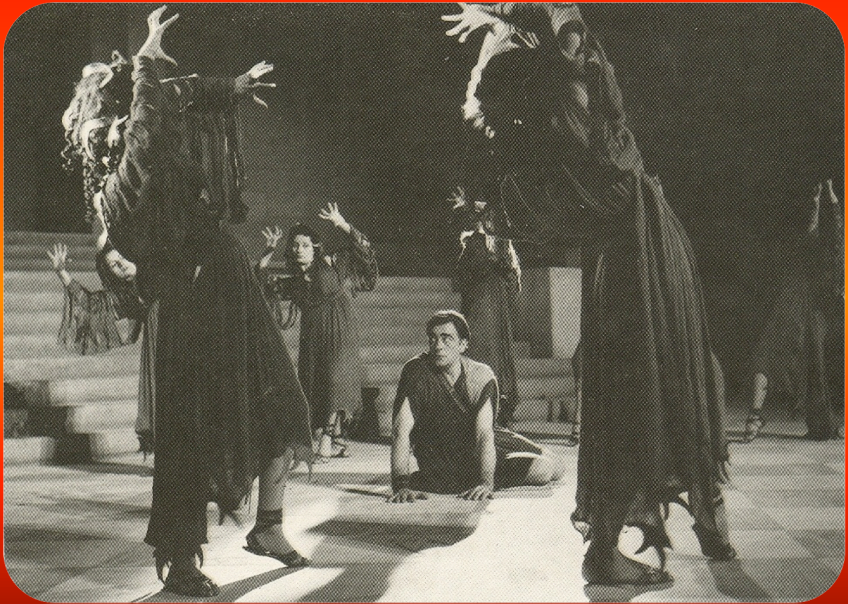
Εικόνα 8: Ορέστεια , «Εθνικό Θέατρο», 1954, σκηνοθεσία: Δημήτρης Ροντήρης