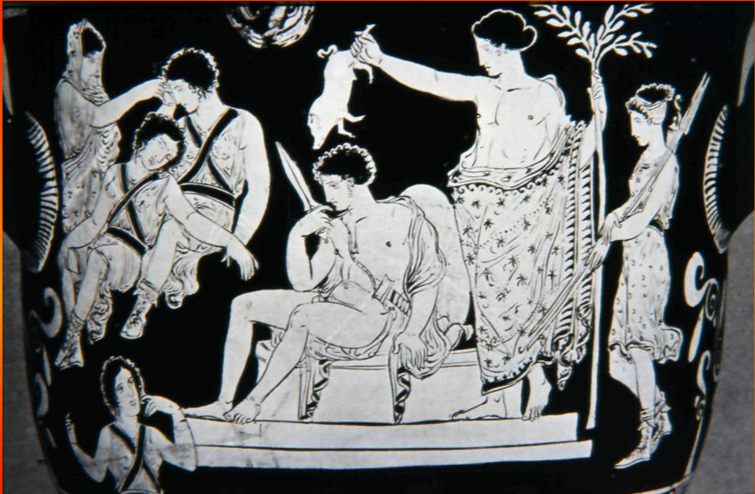
Εικόνα 7: Απουλικός κωδωνόσχημος κρατήρας του 390-380 π.Χ., Στο κέντρο της σύνθεσης ο Ορέστης είναι καθισμένος σε ένα σκαλοπάτι και ακουμπά με την πλάτη στον ομφαλό. Πίσω του ο Απόλλωνας τον εξαγνίζει κρατώντας με το δεξί χέρι ένα χοίρο πάνω από το κεφάλι του και κλαδί δάφνης με το αριστερό. Πίσω του διακρίνεται η Άρτεμις. Στην άλλη πλευρά της σύνθεσης δύο Ερινύες κοιμούνται και η Κλυταιμνήστρα προσπαθεί να τις ξυπνήσει.