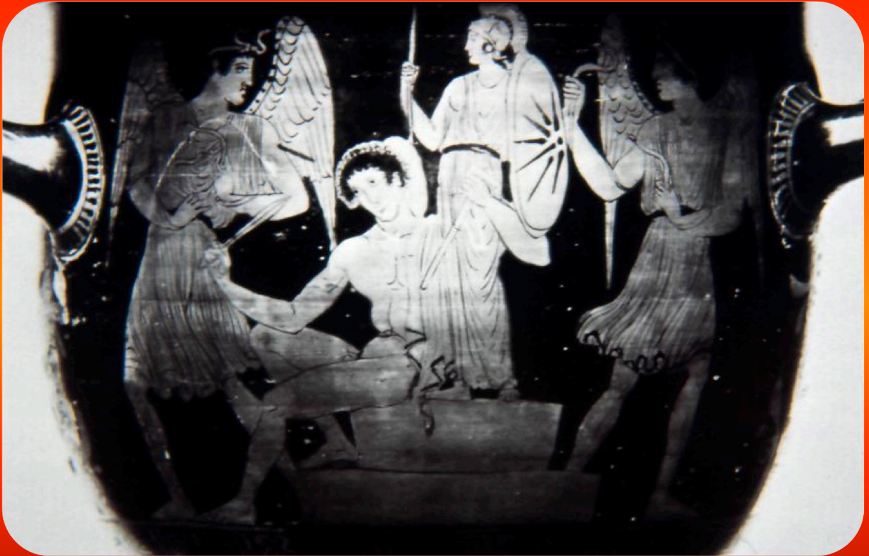
Εικόνα 9: Απουλικός κωδωνόσχημος κρατήρας του 410-400 π.Χ. Ο Ορέστης κρατά με το αριστερό χέρι το Παλλάδιο (άγαλμα της Αθηνάς) και με το δεξί χέρι ξίφος, με το οποίο προσπαθεί να αποκρούσει δύο Ερινύες που βρίσκονται εκατέρωθεν.