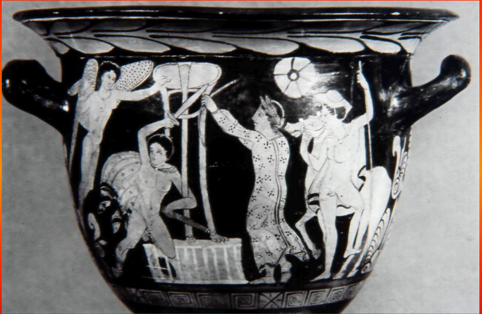
Εικόνα 6: Καμπανικός κωδωνόσχημος κρατήρας του 340 π.Χ., Ο Ορέστης είναι γονατισμένος μπροστά στο δελφικό τρίποδα και προσπαθεί να απομακρύνει μια Ερινύα που βρίσκεται πίσω του. Αριστερά του ο Απόλλωνας σημαδεύει με τόξο την Ερινύα. Πίσω του διακρίνεται ο Πυλάδης με το άλογό του.