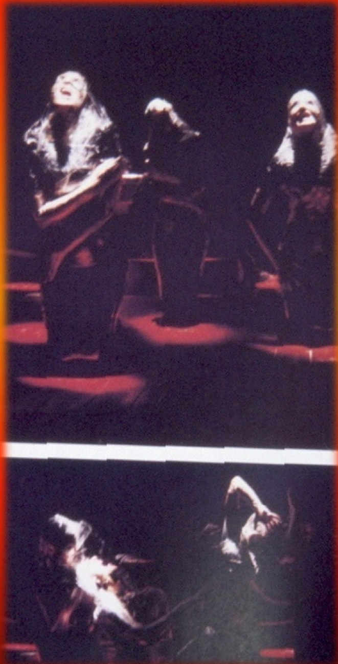
Εικόνα 1: Ορέστεια – Ευμενίδες, «Ανοιχτό Θέατρο», 1993, Σκηνοθεσία: Γιώργος Μιχαηλίδης