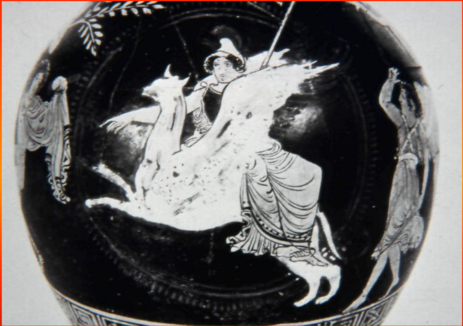
Εικόνα 10: Απουλική οينوχόη του 350 π.Χ..

Στο κέντρο της σύνθεσης παριστάνεται η Αθηνά πάνω σε γρύπα. Δεξιά διακρίνονται δύο Ερινύες και αριστερά ο Ορέστης με τον Απόλλωνα.