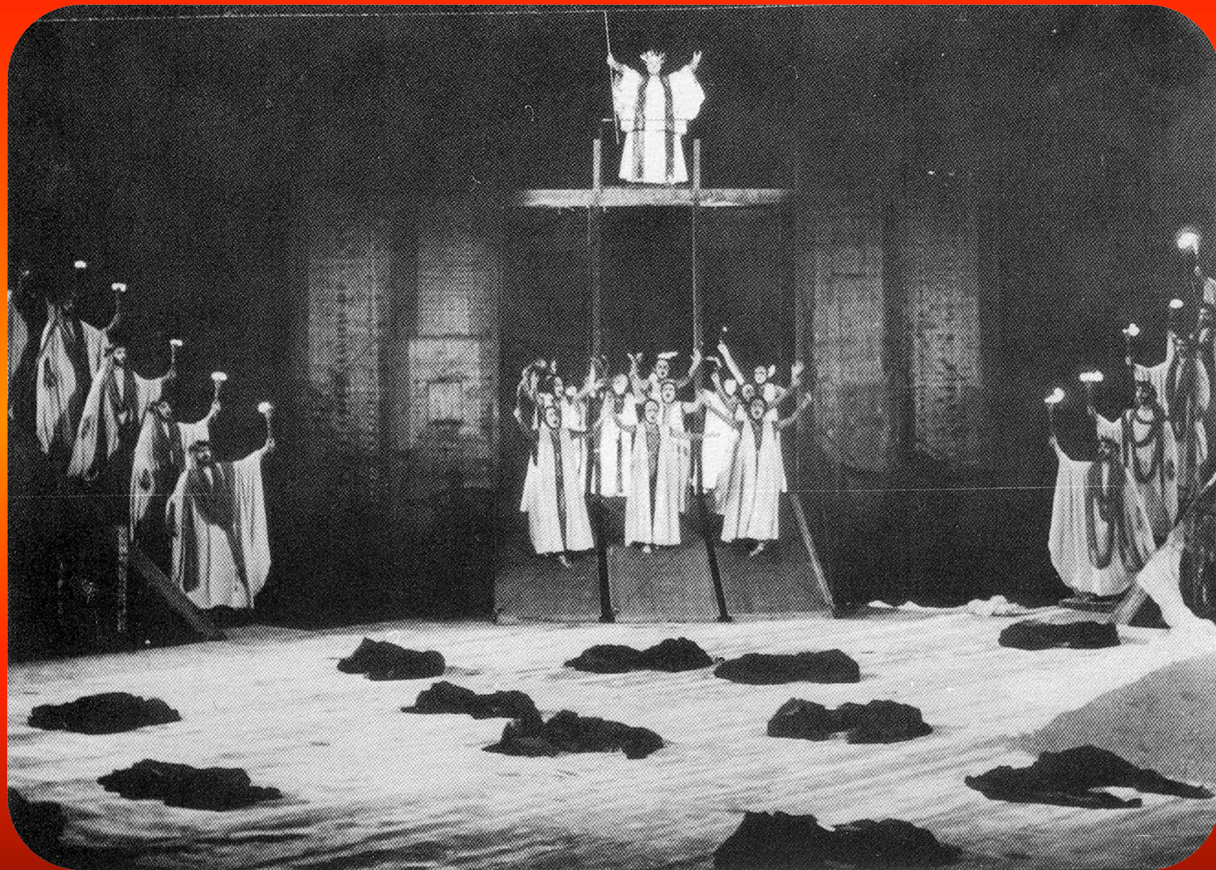
Εικόνα 14: Ευμενίδες , 1990, «Αμφι-Θέατρο», σκηνοθεσία: Σπύρος Ευαγγελάτος