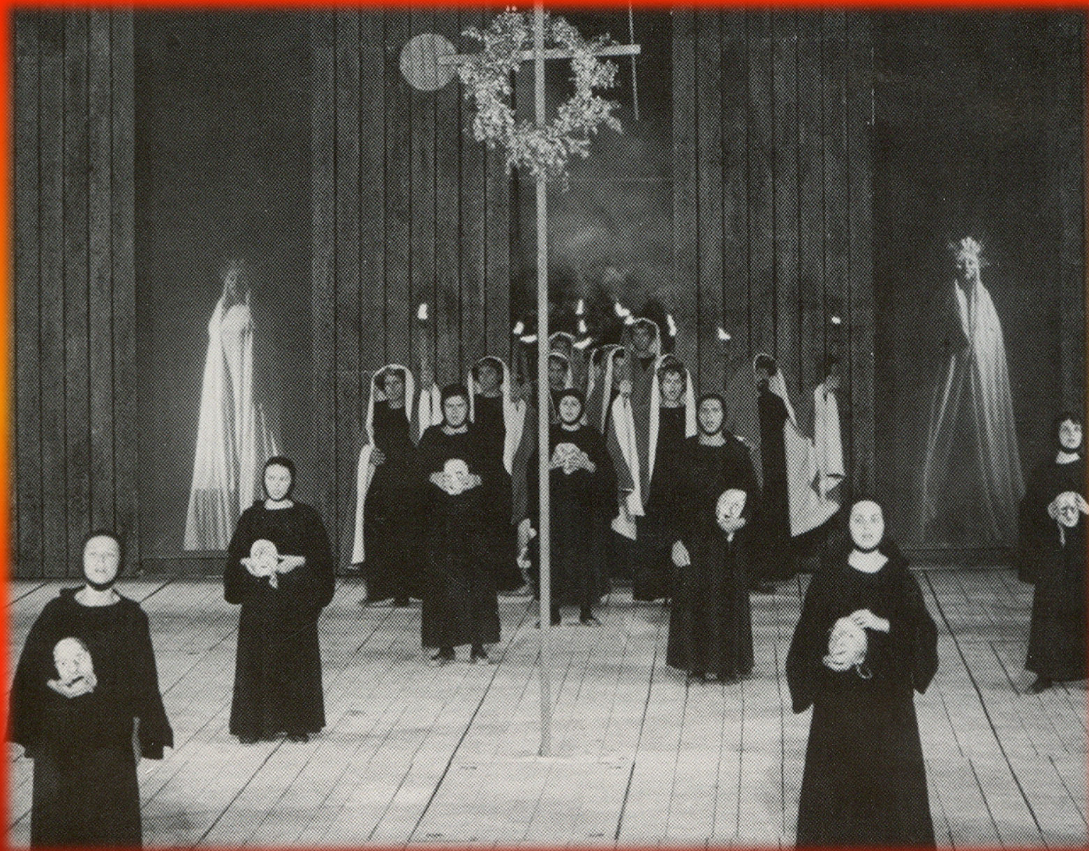
Εικόνα 13: Ορέστεια - Ευμενίδες 1980, «Θέατρο Τέχνης», σκηνοθεσία: Κάρολος Κουν