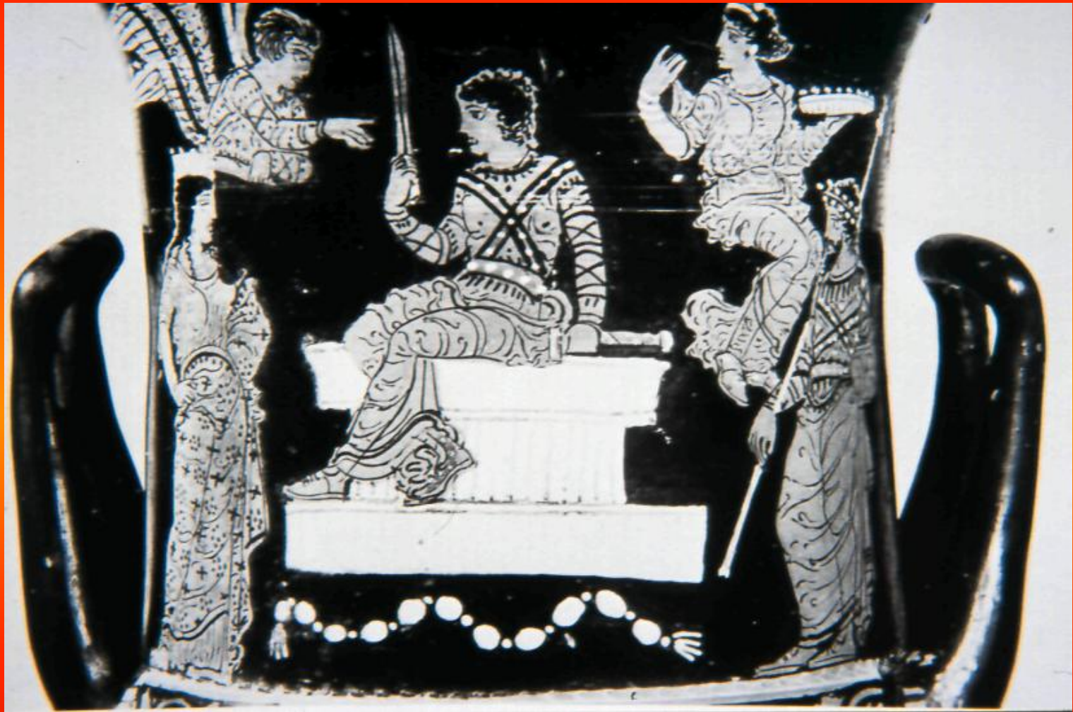
Εικόνα 4: Απουλικός κρατήρας του 350-330 π.Χ.

Στο κέντρο της σύνθεσης ο Ορέστης είναι καθισμένος σε βωμό. Με το δεξί χέρι κρατά το ξίφος του, το οποίο κοιτάζει. Εκατέρωθεν βρίσκονται ο Αγαμέμνονας και η Κλυταιμνήστρα. Στο επάνω επίπεδο της σύνθεσης έχει απεικονιστεί μια υπηρέτρια του ναού του Απόλλωνα με προσφορές στο αριστερό χέρι και μια Ερινύα με μεγάλα φτερά.