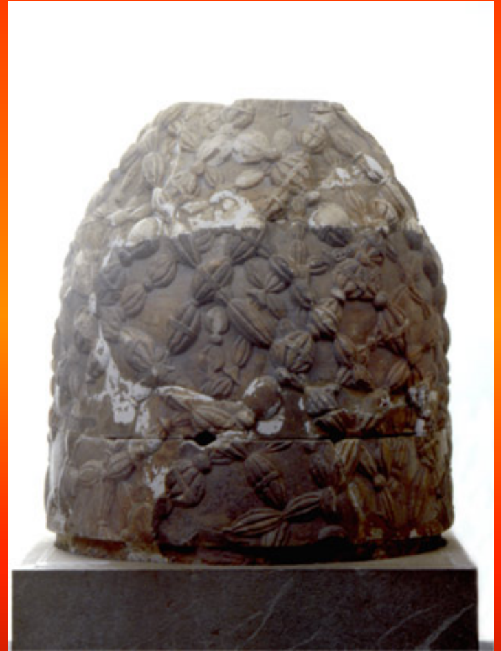
Εικόνα 3: Ο ομφαλός

«Ο ομφαλός αποτελούσε το σύμβολο των Δελφών. Σύμφωνα με το μύθο, όταν ο Δίας θέλησε να βρει το κέντρο του κόσμου, άφησε από τον Όλυμπο ελεύθερους δύο αετούς προς τα αντίθετα άκρα της γης. Οι αετοί συναντήθηκαν επάνω από τους Δελφούς, καθιερώνοντάς τους έτσι ως τον ομφαλό, δηλαδή το κέντρο της γης. Ο μαρμάρινος ομφαλός στο Μουσείο των Δελφών είναι ελληνιστικό ή ρωμαϊκό αντίγραφο του ομφαλού που βρισκόταν στο άδυτο του ναού. Στην κορυφή του στερεώνονταν δύο επιχρυσωμένοι αετοί. Η ανάγλυφη διακόσμηση στην επιφάνειά του απομιμείται το άγρηνον, ένα ύφασμα από μάλλινες ταινίες, που κάλυπτε τον ιερό ομφαλό του αδύτου. Είναι γνωστό ότι στους Δελφούς υπήρχαν και άλλα ομοιώματα του ομφαλού, κατασκευασμένα από διάφορα υλικά. Ίσως ο συγκεκριμένος να είναι ο ομφαλός που είδε ο περιηγητής Πausanίας το 2ο αι. μ.Χ.»