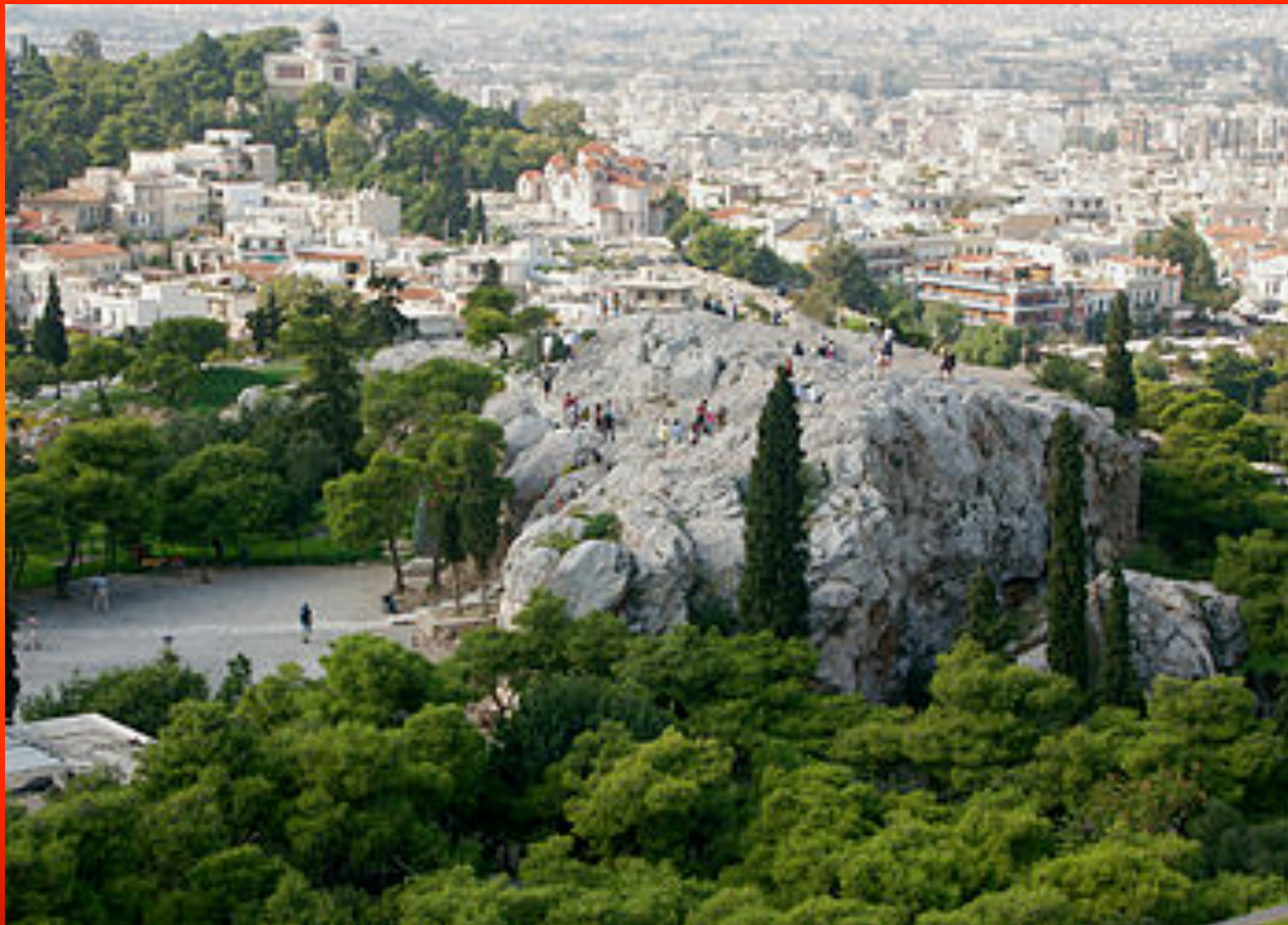
Εικόνα 2: Ο Άρειος Πάγος: ΒΔ της Ακρόπολης