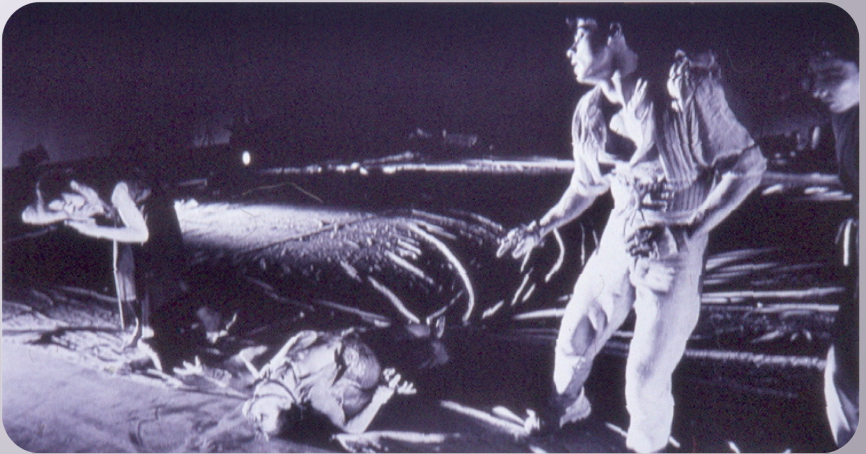
Εικόνα 5: Αισχύλου-Ξενάκη Ορέστεια-Ακολουθία Αισχύλου . ΚΘΒΕ-Ομάδα Εδάφους 1995. Σκηνοθεσία-χορογραφία-εικαστική σύλληψη: Δημήτρης Παπαϊωάννου