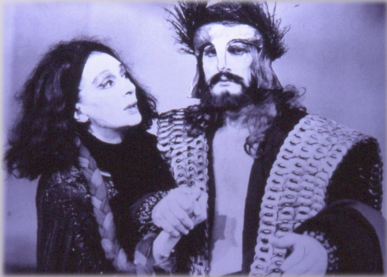
Εικόνα 6: Ορέστεια, «Αμφι-Θέατρο» Σπύρου Ευαγγελάτου 1990