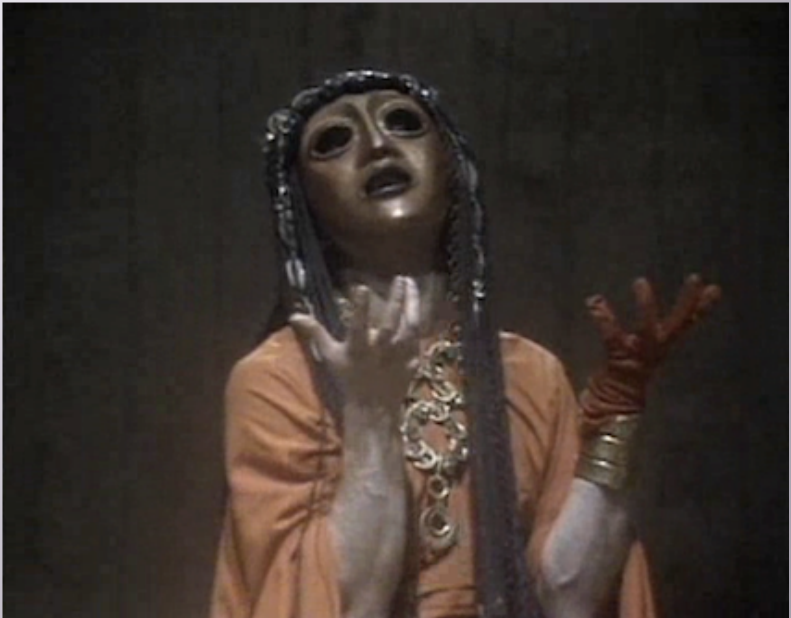
Εικόνα 14: Oresteia , National Theatre UK director: Peter Hall 1980