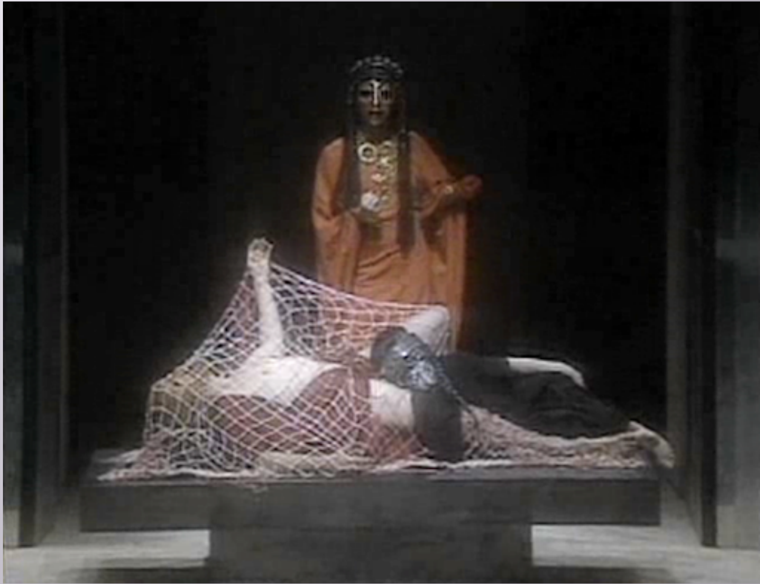
Εικόνα 16: Oresteia , National Theatre UK, director: Peter Hall 1980.