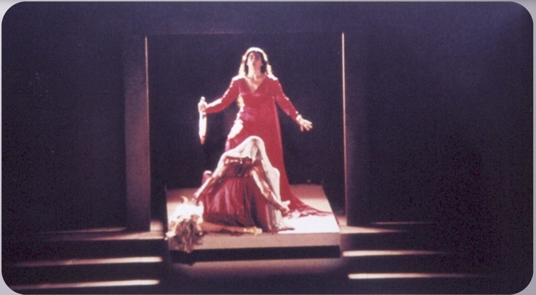
Εικόνα 1: Ορέστεια , Εθνικό Θέατρο 2001, Σκηνοθεσία Γιάννη Κόκκου