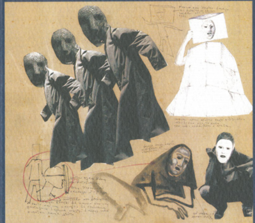
Εικόνα 10: Ορέστεια , Εθνικό Θέατρο – Πειραματική Σκηνή (δραματουργική σύνθεση), 2005 Σκηνοθεσία: Δημήτρης Λιγνάδης