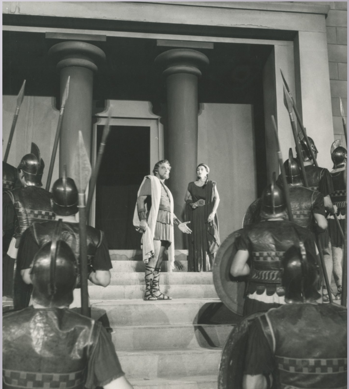
Εικόνα 3: Ορέστεια Εθνικό Θέατρο 1954. Σκηνοθ.: Δημήτρης Ροντήρης