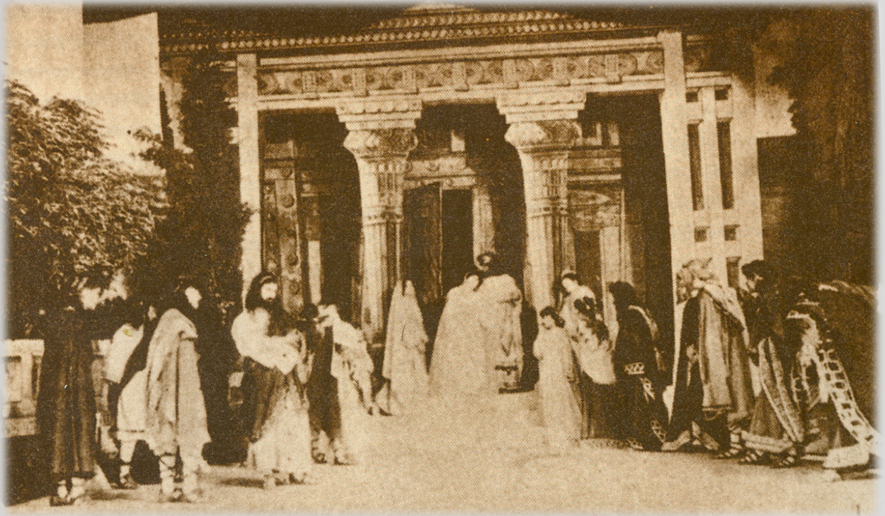
Εικόνα 3: «Νέα Σκηνή», 1901, μετάφραση και σκηνοθεσία Κων/νου Χρηστομάνου