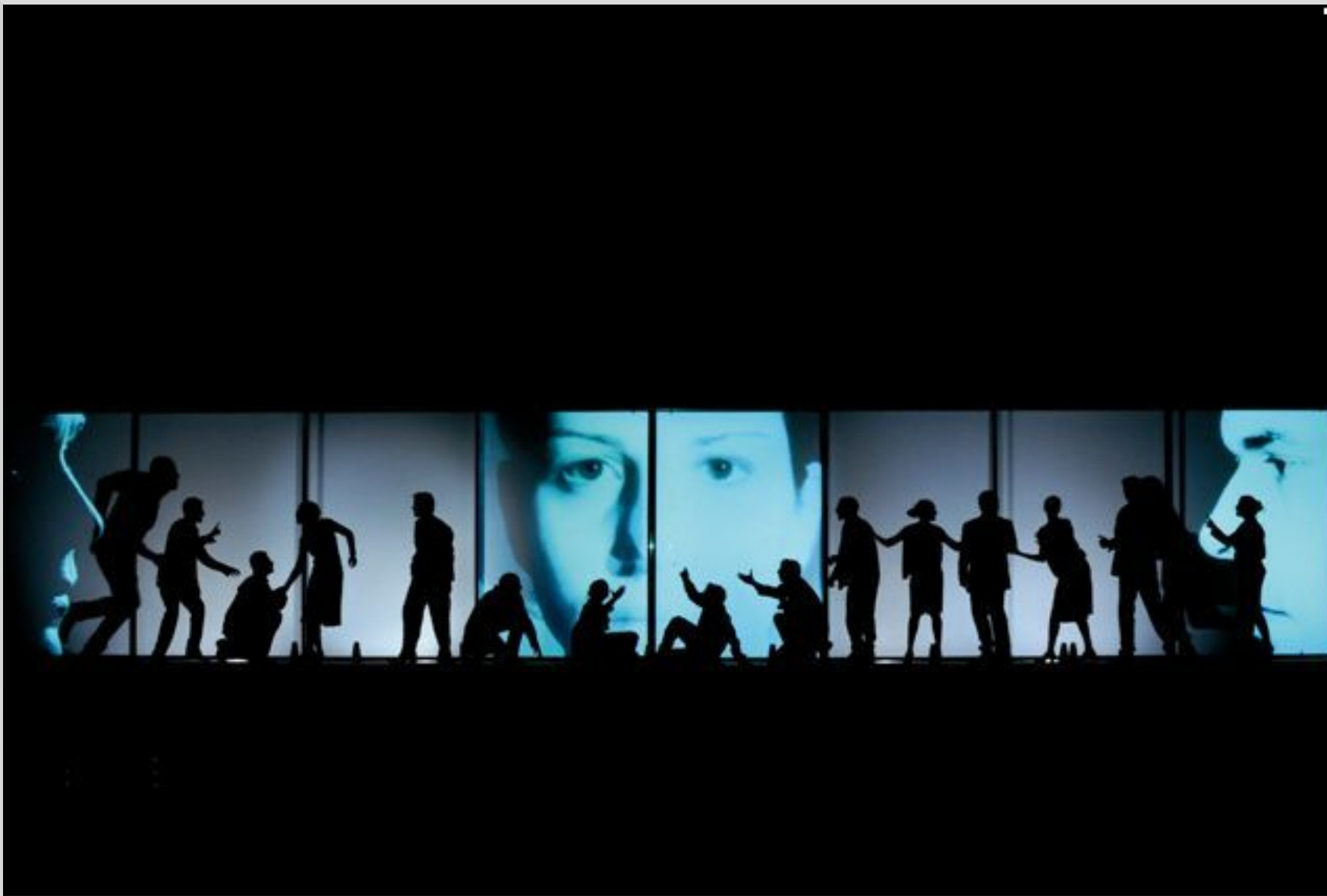
Εικόνα 4: Άλκηστη , Εθνικό Θέατρο, 2009, σκηνοθεσία Θωμά Μοσχόπουλου