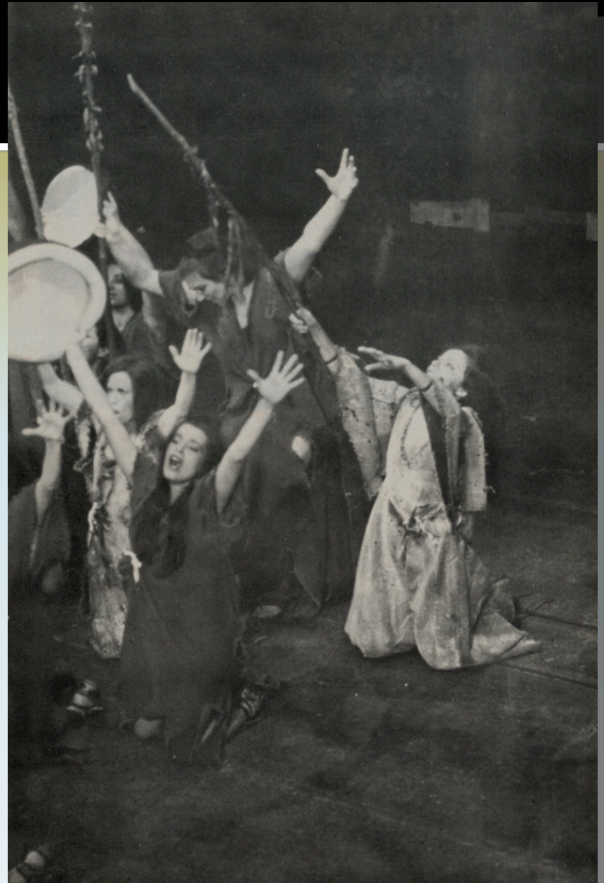
Εικόνα 8: «Εθνικό Θέατρο», 1975. Σκηνοθεσία: Σπύρος Ευαγγελάτος