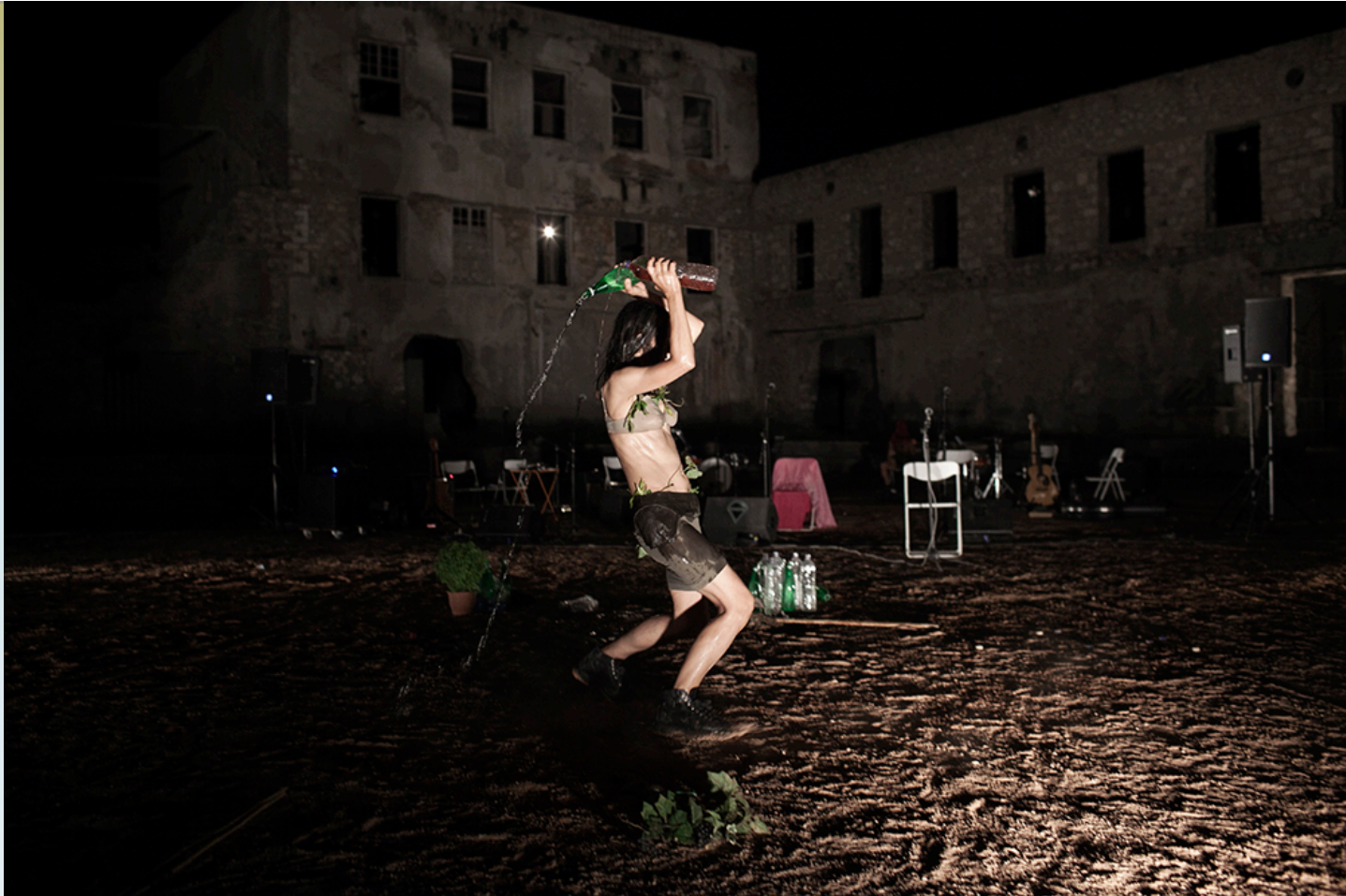
Εικόνα 10: Βάκχες , 2013, σκηνοθεσία Μάρθας Φριντζήλα. Στο Παλαιό Ελαιουργείο Ελευσίνας