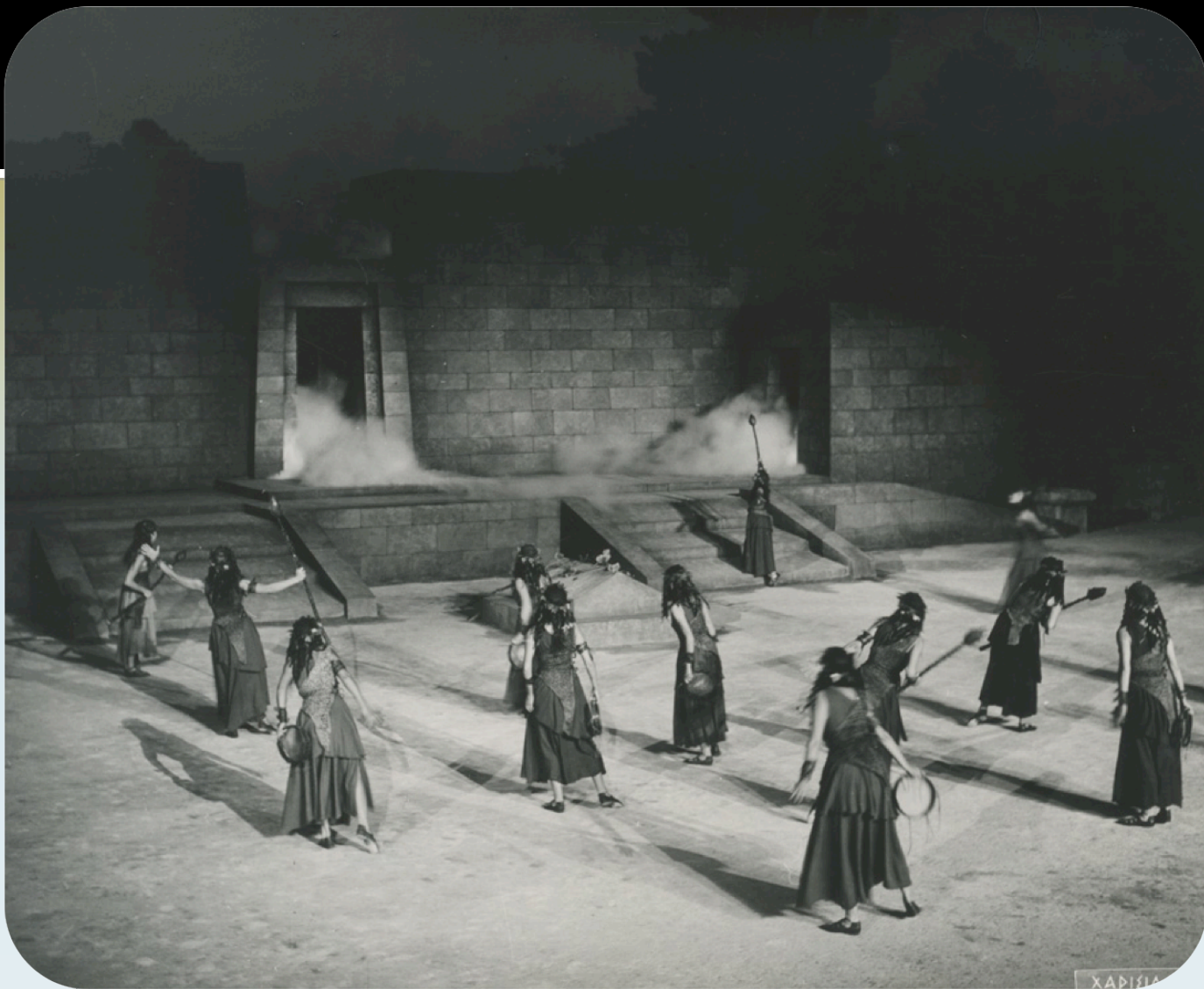
Εικόνα 12: «Εθνικό Θέατρο», 1962. Σκηνοθεσία: Αλέξης Μινωτής