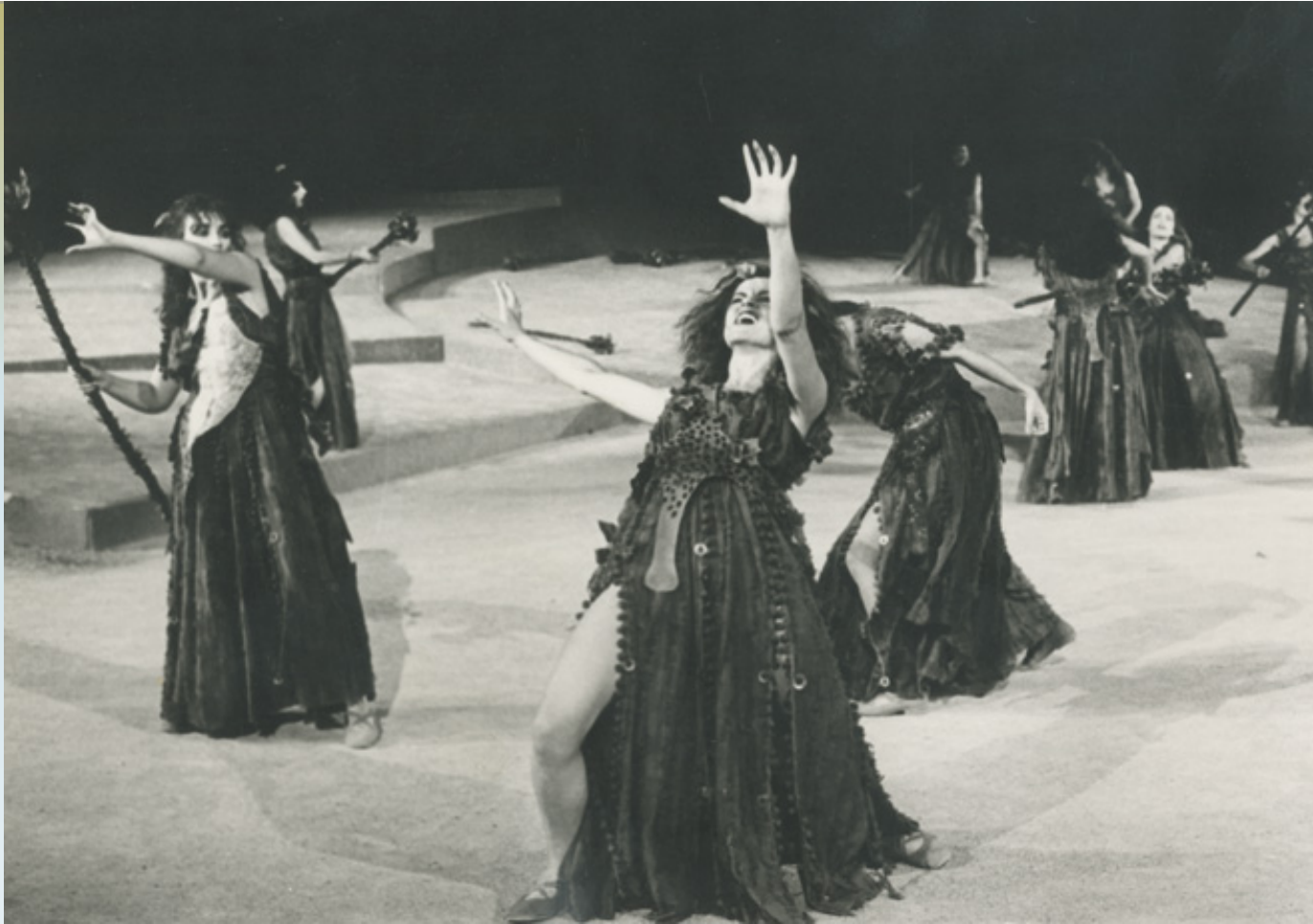
Εικόνα 9: «Εθνικό Θέατρο», 1985. Σκηνοθεσία: Γιώργος Σεβαστίκογλου