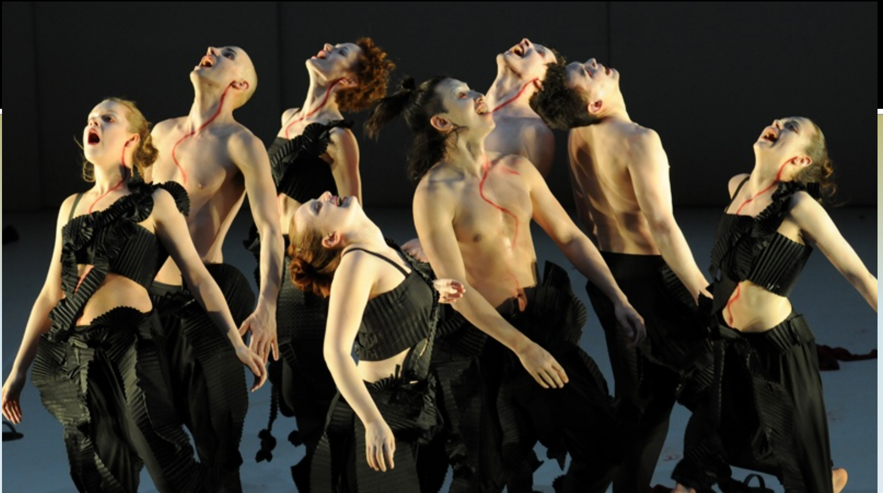
Εικόνα 24: Βάκχες , σκηνοθεσία: Θεόδωρος Τερζόπουλος, 2015 «Electrotheatre Stanislavsky», Μόσχα