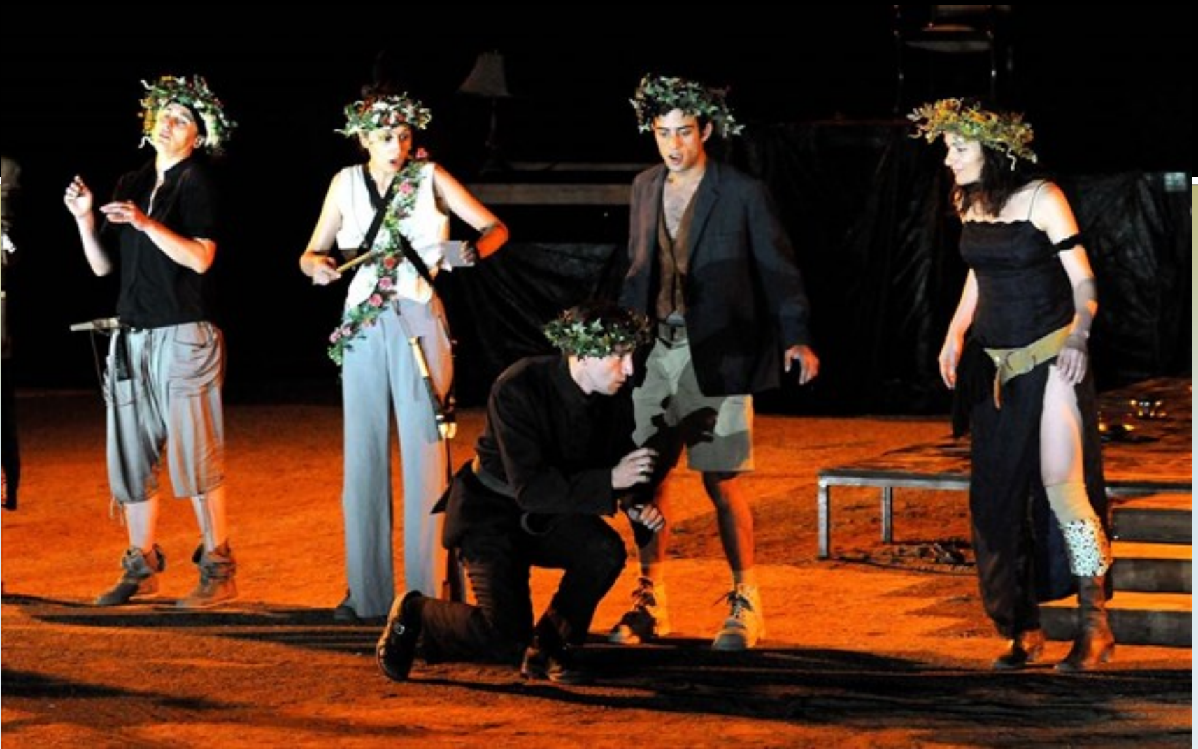
Εικόνα 5: Βάκχες , σκηνοθεσία: Άντζελα Μπρούσκου, 2014, Πενθέας: Άρης Σερβετάλης