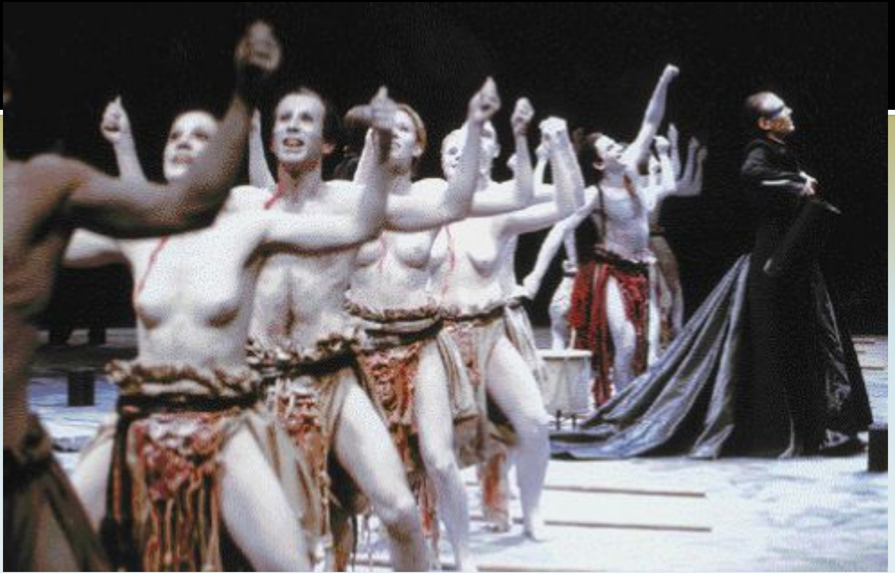
Εικόνα 6: Βάκχες , σκηνοθεσία: Θεόδωρος Τερζόπουλος, 2002