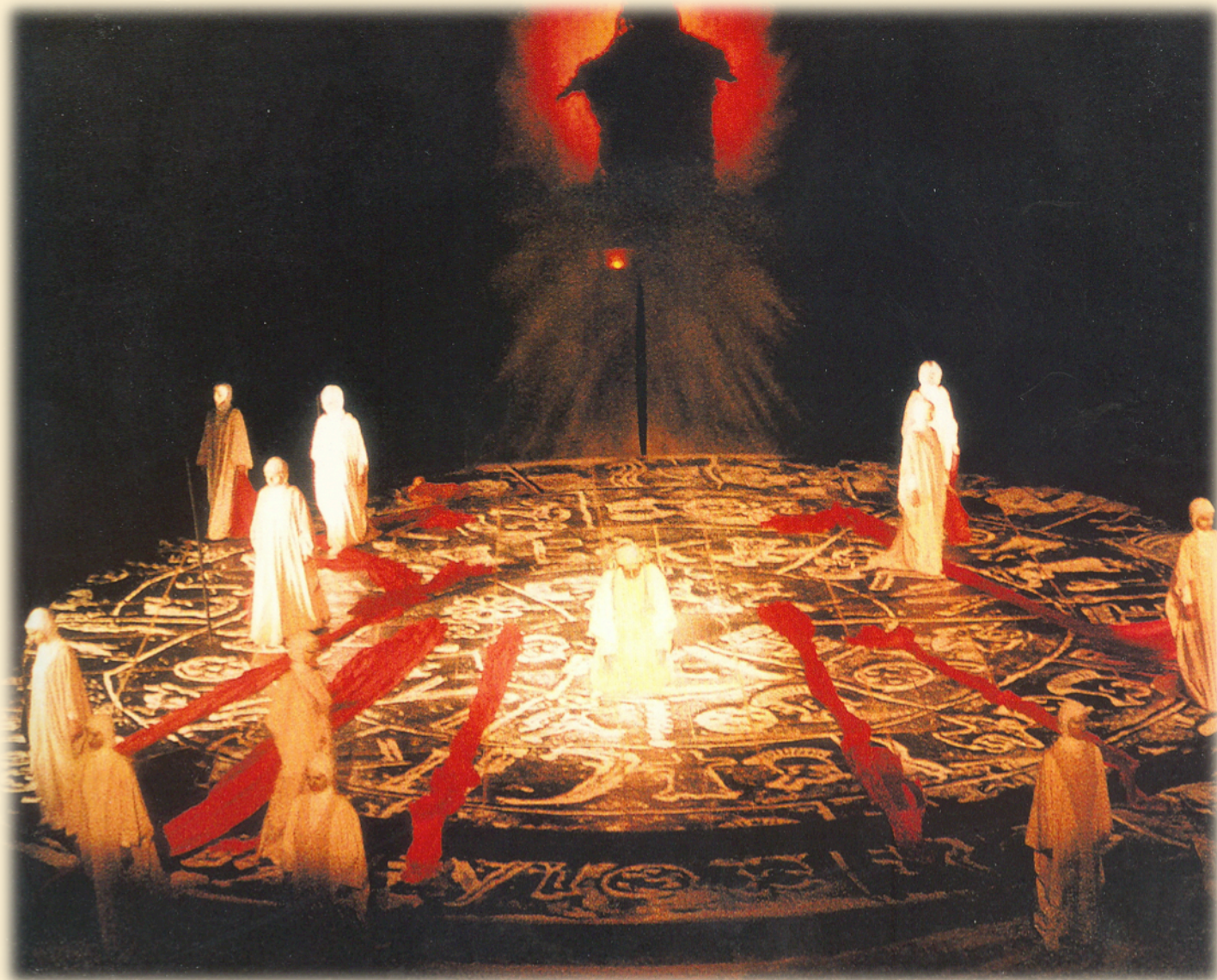
Εικόνα 13: «Θεατρικός Οργανισμός Κύπρου», 1984. Σκηνοθεσία: Διαγόρας Χρονόπουλος Τζένη Γαϊτανοπούλου (Μήδεια) - Στέλιος Καυκαρίδης (Ιάσων)