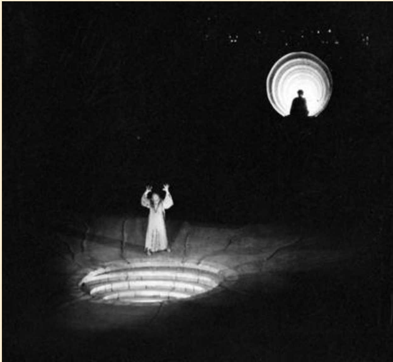
Εικόνα 9: Μήδεια , Κ.Θ.Β.Ε., σκηνοθεσία: Μίνως Βολανάκης, 1976 Μήδεια: Μελίνα Μερκούρη