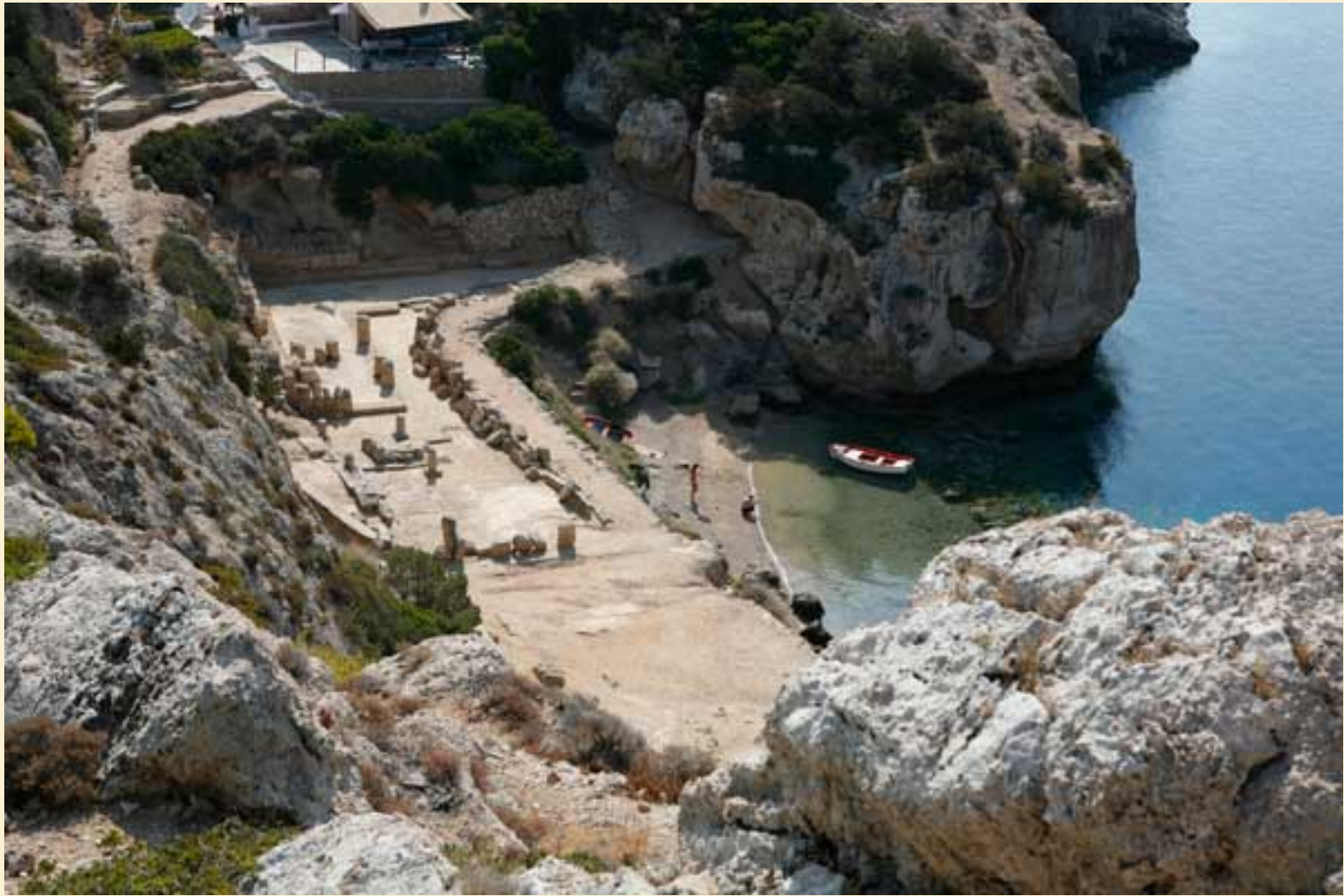
Εικόνα 11: Ναός της Ακραίας Ήρας, βορειοδυτικά του Λουτρακίου, μετά το χωριό της Περαχώρας, στην περιοχή της Λίμνης της Βουλιαγμένης. Ιερό της Ήρας Ακραίας-Λιμενίας. Η λατρεία άρχισε κατά τη γεωμετρική περίοδο. Γύρω στο 800 π.Χ. οικοδομήθηκε ο πρώτος ναός.