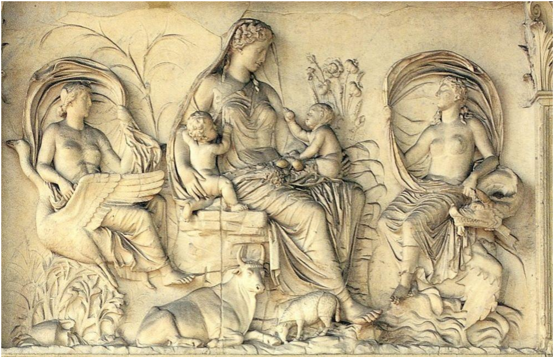
ARA PACIS AUGUSTAE