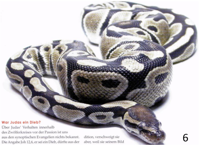
War Judas ein Dieb?

Über Judas' Verhalten innerhalb des Zwölferkreises vor der Passion ist uns aus den synoptischen Evangelien nichts bekannt. Die Angabe Joh 12,6, er sei ein Dieb, dürfte aus der