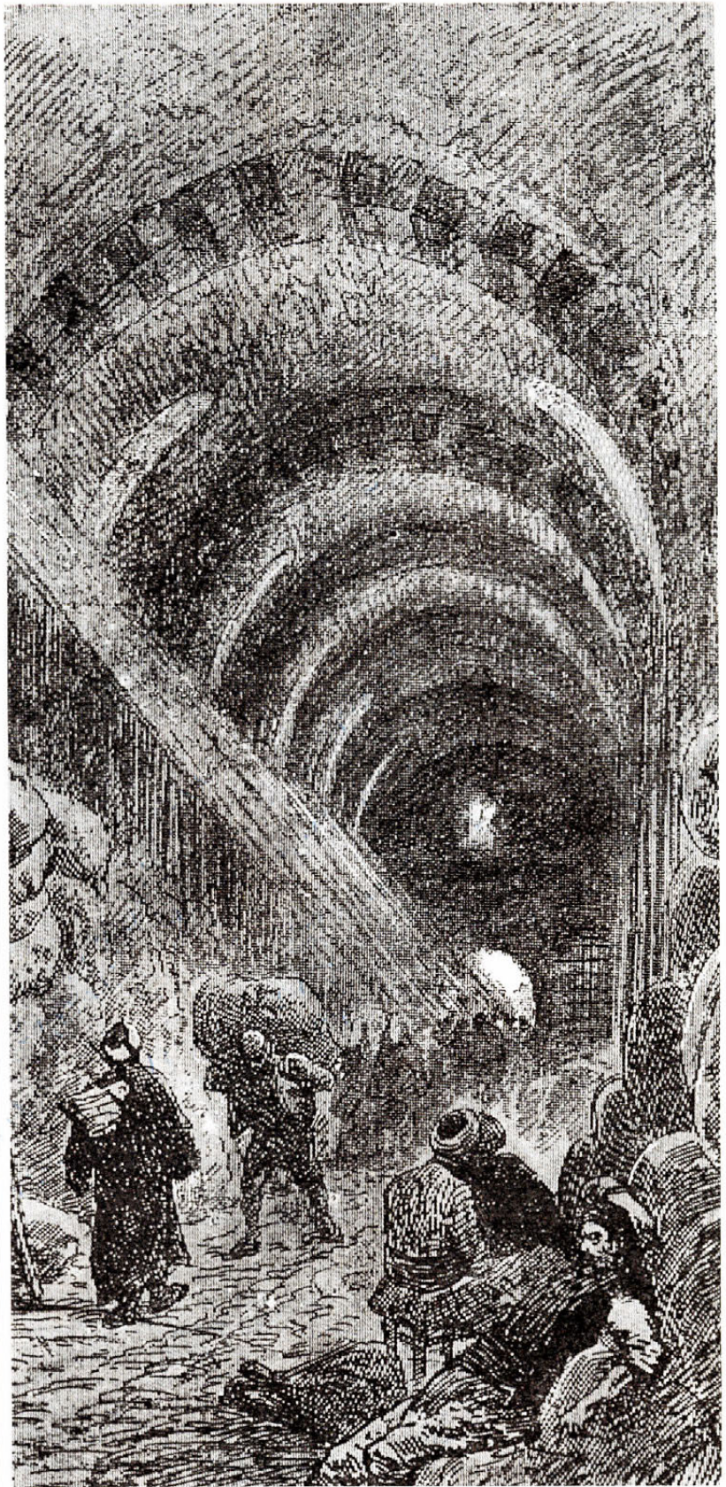
ΠΑΖΑΡΙ ΒΑΜΒΑΚΙΟΥ ΣΤΗΝ ΚΩΝΣΤΑΝΤΙΝΟΥΠΟΛΗ Ed. De Amicis, Constantinople , Παρίσι, 1883, σ. 119.

Η πολιτική εξουσία των φορέων της οικονομικής ζωής γίνεται μεγαλύτερη εκεί όπου οι οικονομικές δραστηριότητες αφορούν όχι μόνο μία πόλη, αλλά μία ευρύτερη περιοχή· έτσι, οι κάτοικοι των Μαντεμοχωρίων της Χαλικιδικής, των Μαστιχοχωρίων της Χίου, των 24 χωριών του Πηλίου καθώς και εκείνοι της πε-