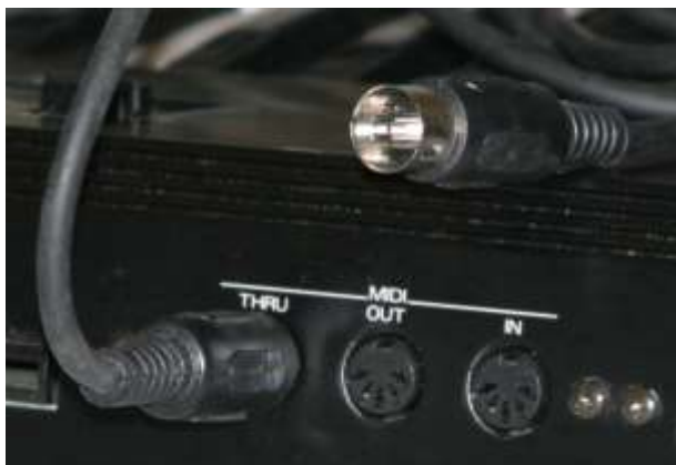
Εικόνα 1 Τύπος πενταπολικού καλωδίου MIDI

Ένα σύστημα εφοδιασμένο με MIDI πρέπει να έχει μια θύρα MIDI IN, μια θύρα MIDI OUT και μια θύρα MIDI THRU τις περισσότερες φορές. Από τη θύρα MIDI IN, το σύστημα μπορεί να λάβει δεδομένα. Από τη θύρα MIDI OUT εξέρχονται οι πληροφορίες που στέλνει το ίδιο το σύστημα. Από τη θύρα MIDI THRU εξέρχεται μια αναπαράσταση του σήματος που υπάρχει στη θύρα MIDI IN, για να μπορεί να τροφοδοτηθεί με τις ίδιες πληροφορίες και κάποια άλλη MIDI συσκευή. Οι θύρες του MIDI είναι θηλυκό standard 5-pin DIN