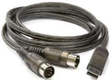
Εικόνα 3 MIDI διασυνδεδετικό σε USB