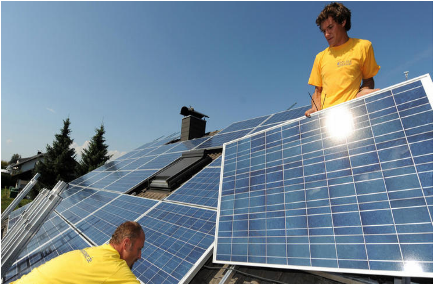
Εικόνα 4: Techniker montieren Solarmodule auf einem Dach