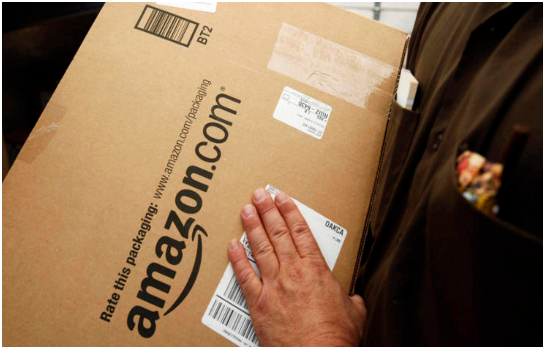
Εικόνα 3: Amazon Paket