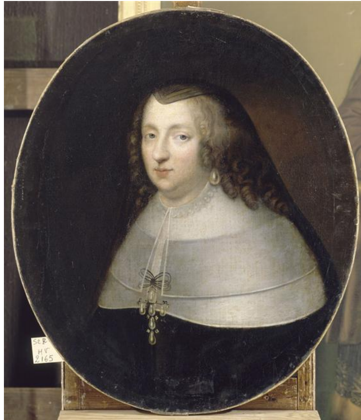
Beaubrun, Anne d'Autriche en habit de veuve