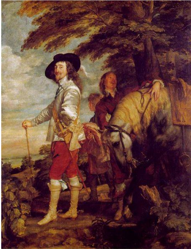
Charles I er