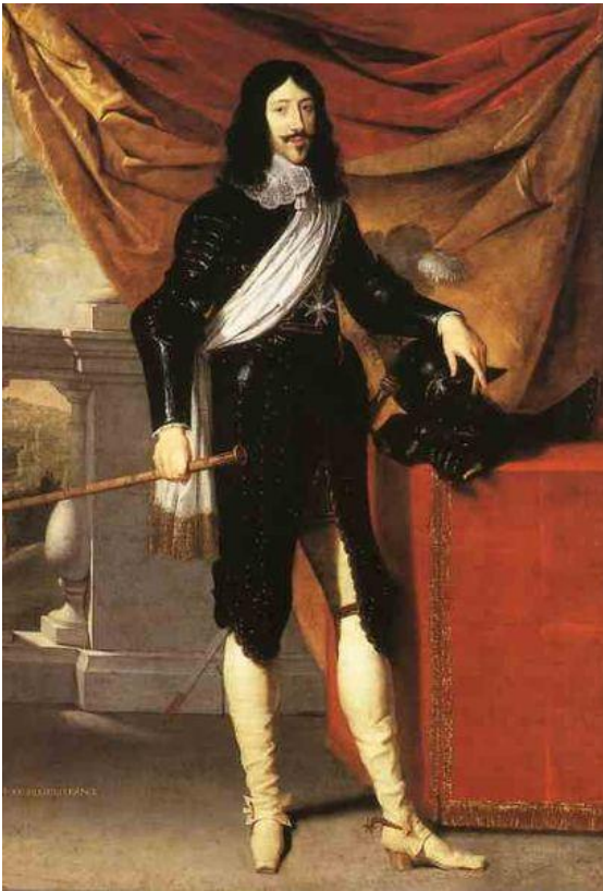
Mort de Louis XIII en 1643