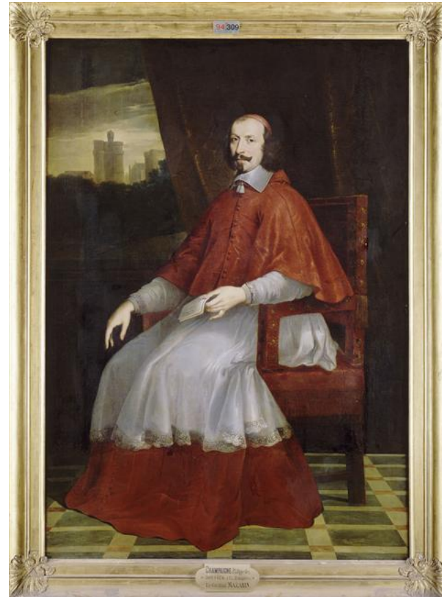
Philippe Champaigne, Le cardinal Mazarin