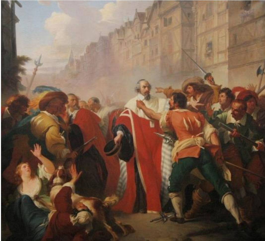
François André Vincent, Molé et les factieux (1779)