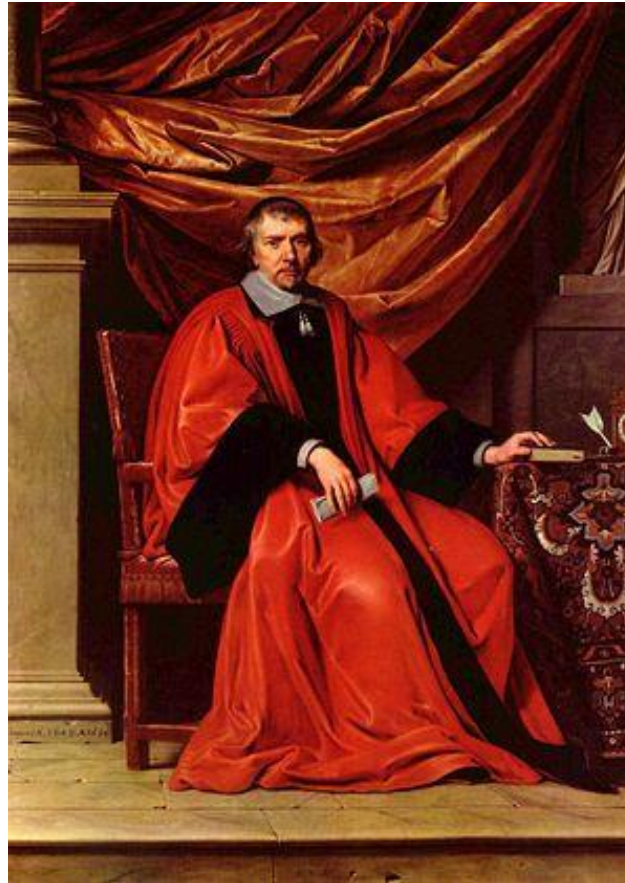
Portrait par Philippe de Champaigne (1649)

défend les prérogatives du parlement contre l'absolutisme