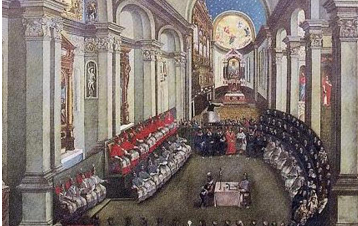
Le Concile de Trente (1545-1563)