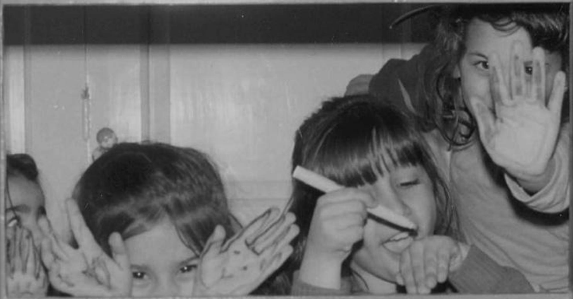
Παιχνίδια με τα χέρια