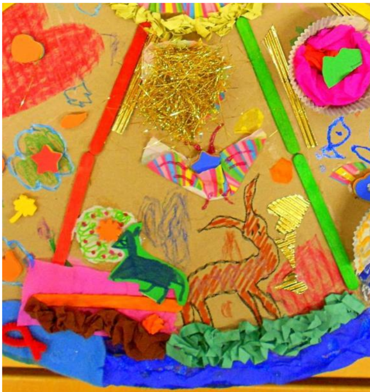
Ζωάκια που παίζουν.