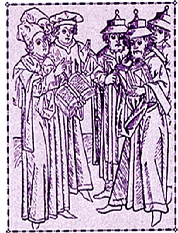
Αντιπαραθήση στην ισπανική Tortosa, 1413-14